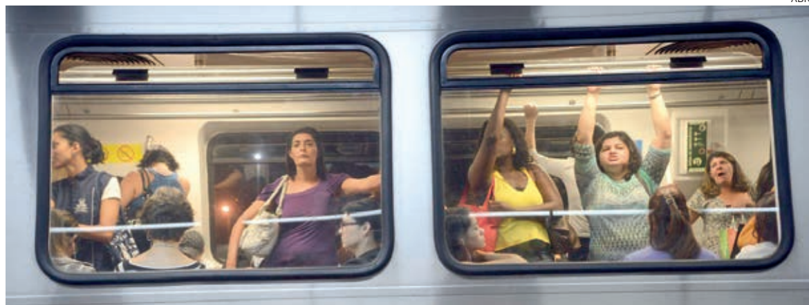
Doença pode causar fortes dores e levar à infertilidade

Segundo a médica, as manifestações clínicas da paciente são importantes, mas não interferem nos graus da doença, por isso, é necessário complementar a investigação com alguns