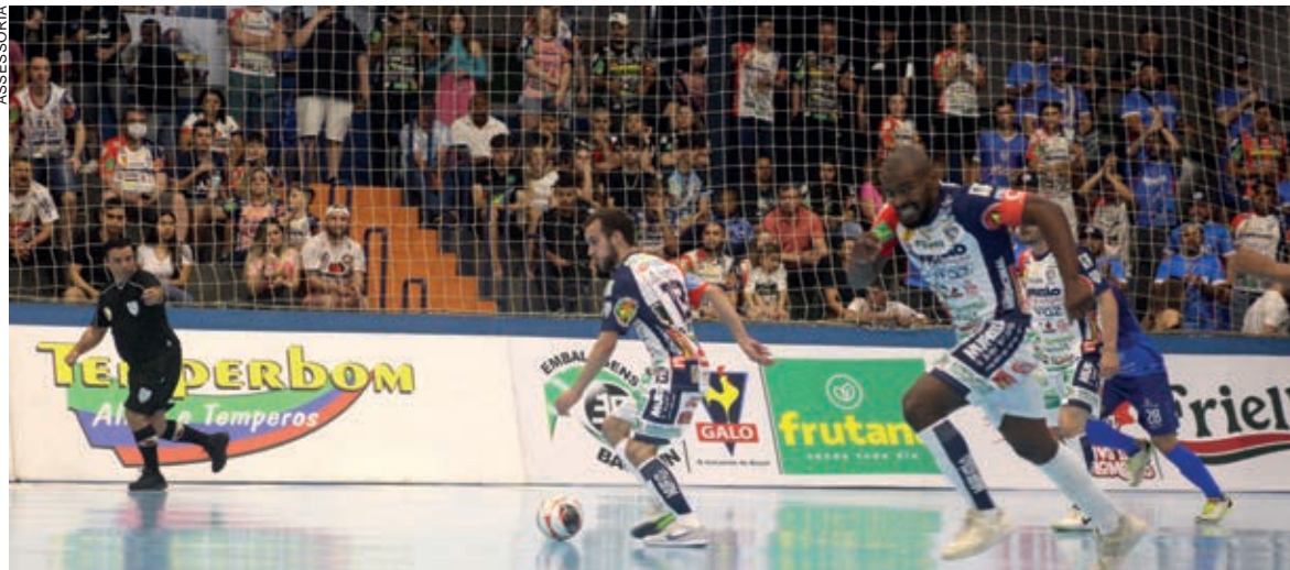
Cascavel perdeu a invencibilidade caseira no estadual

do Cascavel Futsal optou por concentrar os esforços de atletas e comissão técnica nos torneios que já está disputando. Com isso, a Federação Paranaense de Futsal indicou o vice-campeão estadual, Campo Mourão, para a disputa da Taça Brasil, que acontecerá no fim de agosto, em Joinville.