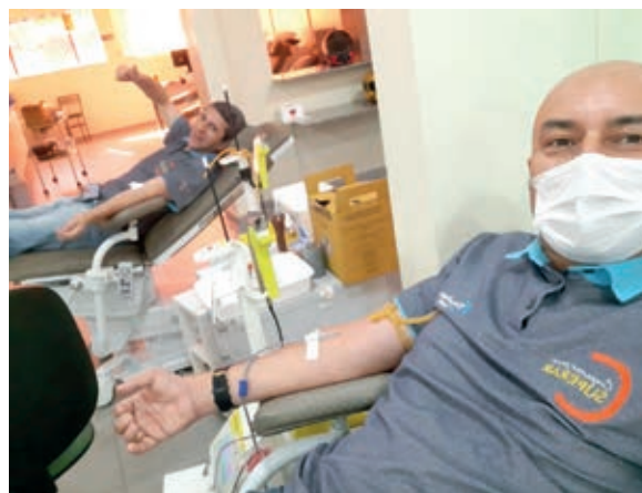
Campanha contou com doação de sangue no Hemocentro de Campo Grande

beneficiadas Apaes, Pastorais da Criança, Cáritas Diocesana, Casas de Apoio para pacientes em tratamento ao câncer, Lares de Idosos, Casas de Acolhimento para crianças e adolescentes em Cafelândia, Jesuítas, Cascavel, Formosa do Oeste, Goioerê, Jotaesse, Nova Aurora e Toledo – no oeste paranaense. Já em Capanema, Planalto e Pranchita, no sudoeste, houve revitalização em escolas, e em Pérola do Oeste, um café especial foi servido para alunos, pais e professores da Apaes. Um dos princípios do cooperativismo é auxiliar e desenvolver a comunidade em que a Cooperativa está inserida.