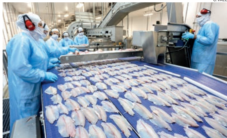
Açude de integrado: peixe é exportado para seis países

ele cultivava 25 mil peixes e um investimento diário de R$ 400 a R$ 500 atribuídos aos 250 quilos de ração. “Antes da pandemia, o saco de 25 quilos de ração custava entre R$ 36 e R$ 46. Hoje, não se compra por menos de R$ 150”. Agora, o produtor tem apenas algumas tilápias matrizes para fazer a desova dentro dos tanques para suprir a carência alimentar dos dourados.