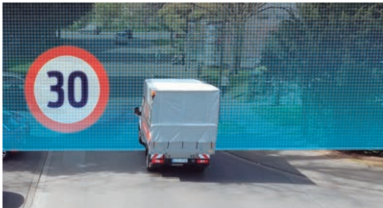
Novo sistema testado pela Ford na Europa mostra como a conectividade pode melhorar o trânsito nas cidades

“A tecnologia de veículos conectados pode comprovadamente ajudar a tornar o trânsito mais fácil e seguro