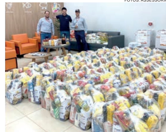
Formosa do Oeste arrecadou 3,6 toneladas de alimentos

Devido ao grande volume de ações, o Dia C da Copacol virou Mês do Cooperativismo: as atividades ocorreram durante julho inteiro. Colaboradores, integrantes dos Grupos Femininos,