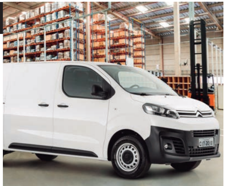
A Jumpy, van diferenciada, registrou um aumento nas vendas de 5% nos primeiros meses deste ano

“Considerando que o segmento DVAN registrou queda de 12% neste primeiro semestre, comprovamos que a Jumpy é um produto diferenciado por meio de sua plataforma modular de última geração, excelente espaço interno e conforto de rodagem de alto nível. Hoje, acompanhando uma tendência do mercado na busca por veículos mais limpos, já oferecemos a versão