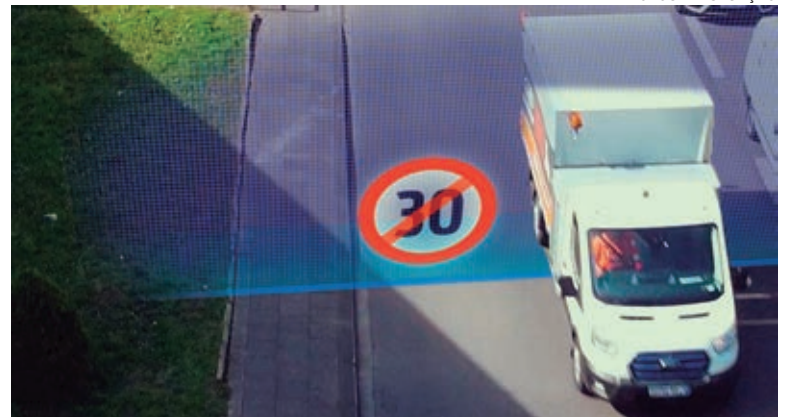
Além de aumentar a segurança de todos os usuários e evitar multas, a funcionalidade ajuda a tornar o cenário urbano mais limpo

Nos testes realizados pela Ford em Colônia, na Alemanha, estão sendo usadas duas vans elétricas Ford E-Transit para analisar o impacto da limitação de velocidade na melhoria do tráfego e redução de acidentes. O teste de 12 meses abrange todas as zonas de 30 km/h no centro de Colônia, na Alemanha, e zonas selecionadas de