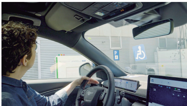
O protótipo, comandado pelo smartphone, começou a ser testado por pesquisadores da marca na Europa

No futuro, o sistema desenvolvido pela Universidade de Dortmund, na Alemanha, poderá ser instalado em vagas para deficientes em estacionamentos ou residências. Outra aplicação seria o carregamento rápido de frotas de empresas. Mais à frente, o processo poderá ser totalmente automatizado, com mínimo ou nenhum