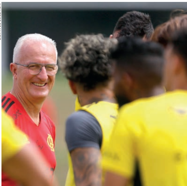
Dorival Junior aposta na manutenção do time para seguir com vitórias

Rio de Janeiro – “Muito difícil”. “Acirrado”. Várias foram as formas utilizadas pelos jogadores do Flamengo para expressar o que esperam da partida pelas semifinais da Libertadores contra o Vélez Sarsfield. O primeiro jogo acontece nesta quarta-feira (31), 21h30, em território argentino. O jogo da volta será na próxima quarta-feira, no Maracanã.