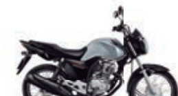
3º Prêmio: Motocicleta CG 160cc START - Ano/Modelo 2022