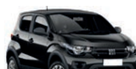
2º Prêmio: Fiat Mobi EASY 1.0 FLEX MANUAL, Ano 2021, Modelo 2022