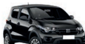
2º Prêmio: Fiat Mobi EASY 1.0 FLEX MANUAL, Ano 2021, Modelo 2022