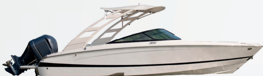
1º Prêmio: Lancha motorboat Evinrude 225

Sorteio 30/11/2022 pela extração da Loteria Federal