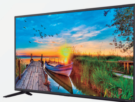
4º Prêmio: Televisor 43'