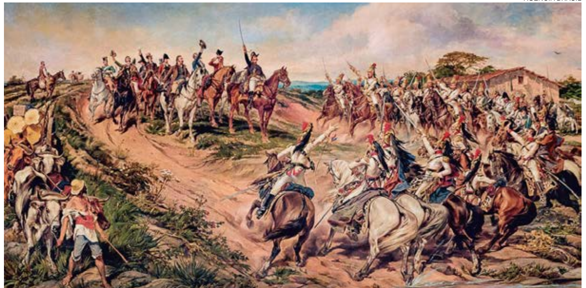
Quadro “Independência ou Morte”, de Pedro Américo, é uma metáfora sobre o dia do Grito do Ipiranga; pintura de 1888, está exposta no Museu do Ipiranga

conselheiro de Dom Pedro, estava lá em 1822 e no seu depoimento escrito, em momento algum, lembra-se do famoso “independência ou morte!”. Para o padre, Dom Pedro teria dito algo assim: “Nada mais quero com o governo português e proclamo o Brasil para sempre, separado de Portugal”.