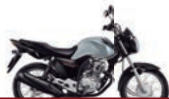
3º Prêmio: Motocicleta CG 160cc START - Ano/Modelo 2022