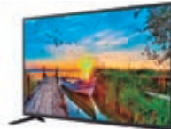
4º Prêmio: Televisor 43'