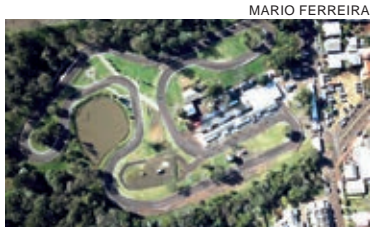
O Kartódromo Ayrton Senna, em Pato Branco, vive a partir desta quarta-feira os agitos da 2ª etapa do Paranaense de Kart

Nesta quarta e quinta-feira os treinos serão particulares. A programação oficial começa na sexta-feira com treinos livres. No sábado serão realizados novos treinos livres, treinos classificatórios e das duas primeiras provas classificatórias de todas as categorias. As finais estão programadas para domingo. O evento terá promoção e organização do Kart Clube de Pato Branco, com supervisão da Federação Paranaense de Automobilismo (FPrA).