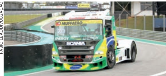
Pedro Muffato repete atuação de Cascavel e larga na frente na Fórmula Truck em Interlagos