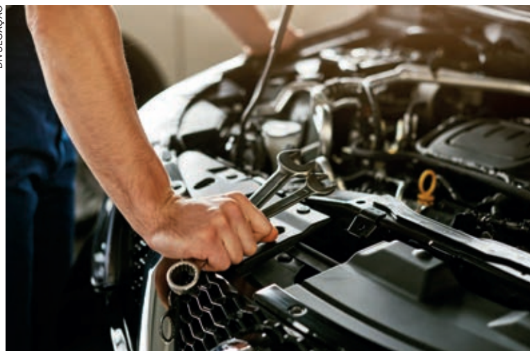
Na revisão, é importante saber o que deve ser checado

Mas também é informado no manual do veículo que,