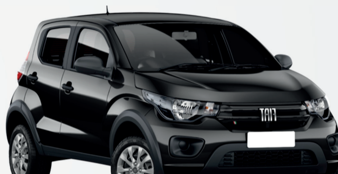
2º Prêmio: Fiat Mobi EASY 1.0 FLEX MANUAL, Ano 2021, Modelo 2022