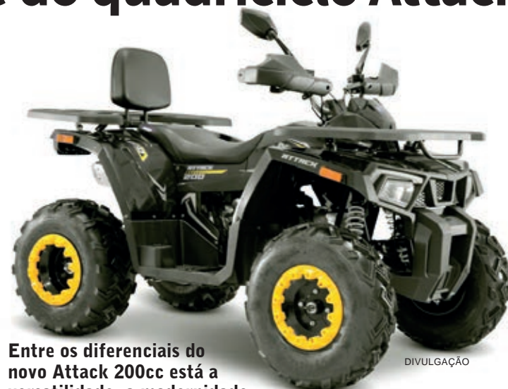
Entre os diferenciais do novo Attack 200cc está a versatilidade, a modernidade e a tecnologia do veículo

Os freios são hidráulicos e a disco, acionados na mão, como nas motocicletas, o que traz maior controle e segurança ao condutor. Para quem deseja utilizar o Attack 200cc