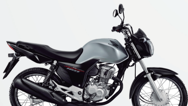
3º Prêmio: Motocicleta CG 160cc START - Ano/Modelo 2022