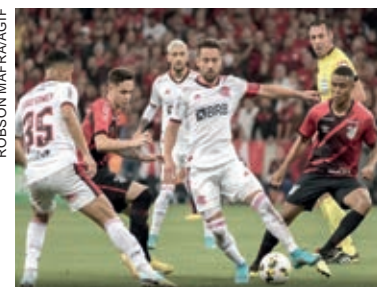
Athletico e Flamengo voltam a se enfrentar em uma fina

Esta será a terceira final entre os dois times brasileiros. Nas duas decisões anteriores, o time carioca levou a melhor na Copa do Brasil de 2013 e a Supercopa de 2020. Pela Libertadores, os times já se enfrentaram em dois jogos, ambos em 2017, quando caíram no mesmo grupo. O Flamengo venceu por 2 a 1, no Rio de