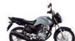
3º Prêmio: Motocicleta CG 160cc START - Ano/Modelo 2022