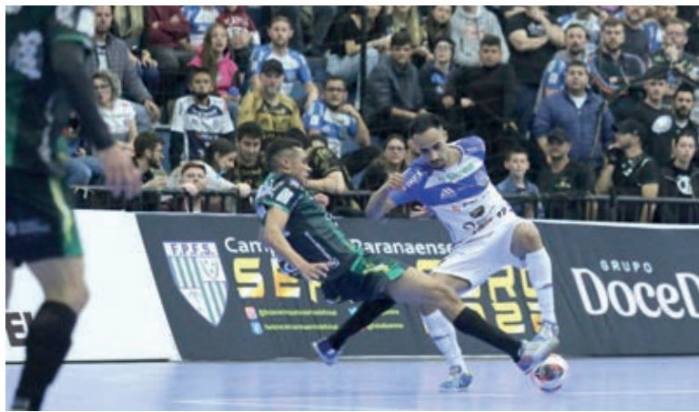
Pato venceu o clássico e será próximo adversário do Cascavel

A próxima rodada da Série Ouro está marcada para dia 14 de setembro, quarta-feira, com o Cascavel Futsal recebendo o Pato Branco.