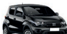
2º Prêmio: Fiat Mobi EASY 1.0 FLEX MANUAL, Ano 2021, Modelo 2022