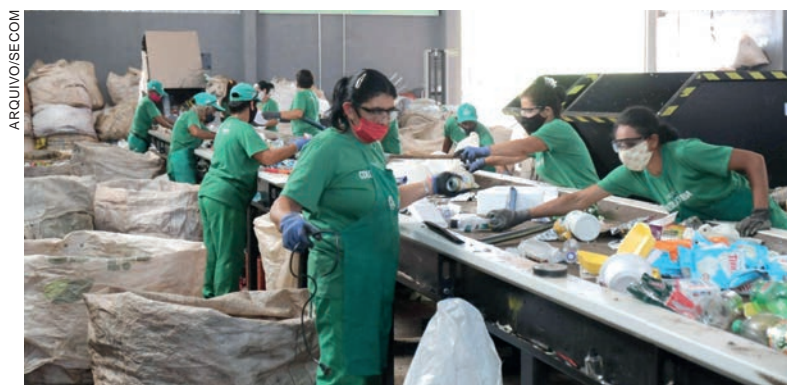
Paraná conquistou 1ª posição no pilar sustentabilidade ambiental, que envolve coleta e reciclagem de lixo

O Paraná ainda se destacou na região Sul pelo salto de cinco posições no indicador de solidez fiscal, subindo para a