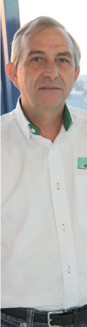
Rubens Gatti diz que Felipe Drugovich dará muitas alegrias aos brasileiros

O paranaense Felipe Drugovich é o primeiro campeão da Fórmula 2 e mais um talento do estado a chegar à Fórmula 1. O piloto de Maringá conquistou sábado (10) o título da Fórmula 2, sendo o primeiro brasileiro a ser campeão da categoria, e nesta segunda-feira foi anunciado como piloto reserva da equipe de Fórmula 1 Aston Martin, fazendo o seu primeiro treino em novembro em Abu Dhabi.