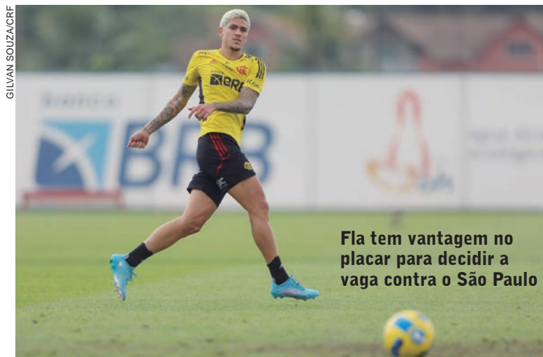
Fla tem vantagem no placar para decidir a vaga contra o São Paulo

do Brasil frente Gana, no dia 23, e a Tunísia, dia 27, em jogos que serão realizados na França. Nas mesmas datas, o Uruguai encara