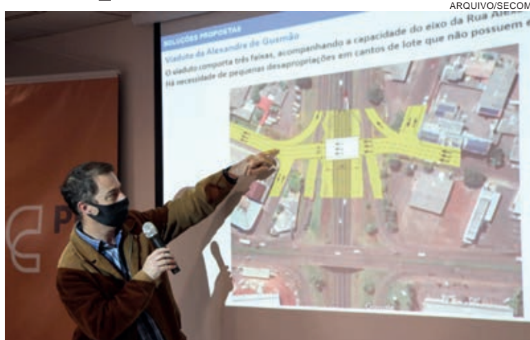
Discussão sobre a “nova Carlos Gomes” vem acontecendo desde o ano passado

Na justificativa do projeto assinado pelo prefeito Leonaldo Paranhos encaminhado ao Legislativo, a solicitação do adiantamento do valor de 2023 para ainda este ano, se deve a finalização dos projetos da nova avenida. Os valores são financiados por meio do PDU (Programa de Desenvolvimento Urbano) de Cascavel do Fonplata (Fundo Financeiro