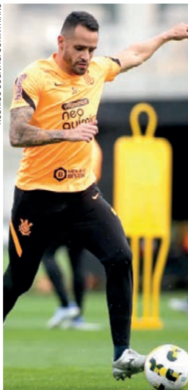
Corinthians aposta no fator casa para ficar com a vaga na final