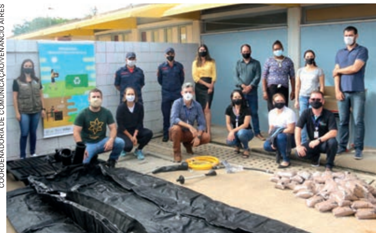
COORDENADORIA DE COMUNICAÇÃO/GOVERNADORIA AÍRES

“A partir do momento que uma escola ganha um selo,