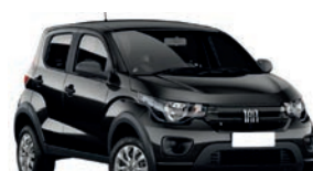
2º Prêmio: Fiat Mobi EASY 1.0 FLEX MANUAL, Ano 2021, Modelo 2022