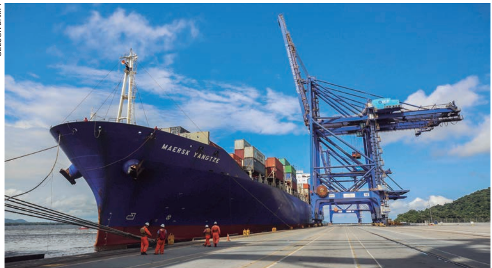
Embora positivo, saldo no ano é 96% menor do que o verificado no acumulado no mesmo período de 2021

As vendas para cinco mercados representam 41% de tudo que o estado exportou no mês. O restante está distribuído entre outros 167 países. O destino principal das mercadorias paranaenses é a China. Para lá foram exportados 16% de tudo que foi negociado em agosto. Argentina (8%),