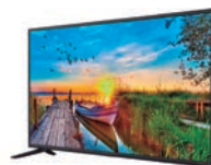
4º Prêmio: Televisor 43'