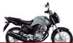
3º Prêmio: Motocicleta CG 160cc START - Ano/Modelo 2022