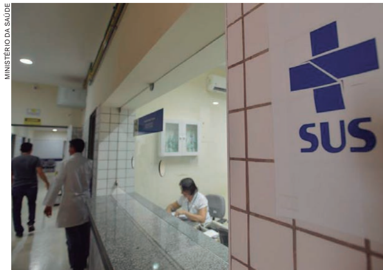
MINISTÉRIO DA SAÚDE

São responsáveis pela execução das ações e serviços de saúde no âmbito do seu território. O gestor municipal deve aplicar recursos próprios e os repassados pela União e pelo estado. O município formula suas próprias políticas de saúde e também é um dos parceiros para a aplicação de políticas nacionais e estaduais de saúde. Ele coordena e planeja o SUS em nível municipal, respeitando a normatização federal.