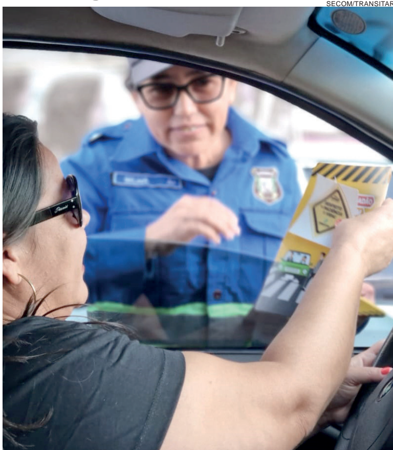
Mais uma vez o foco da Semana Nacional do Trânsito é a conscientização

De acordo com a Transitar, todos os condutores abordados foram submetidos ao teste do etilômetro, sendo realizados 45 testes de alcoolemia, sendo que 4 motoristas foram enquadrados em crime de trânsito. Do total de 42 autuações emitidas na operação, oito foram por condutores não habilitados e quatro pela falta do uso da cadeirinha. Além disso, oito veículos foram