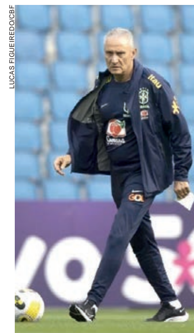
Tite faz últimos testes na formação da seleção

Após enfrentar Gana, o Brasil volta a campo no dia 27 para encarar a Tunísia, no Parque dos Príncipes. Este será o último amistoso antes da estreia na Copa do Mundo contra a Sérvia no dia 24 de novembro.