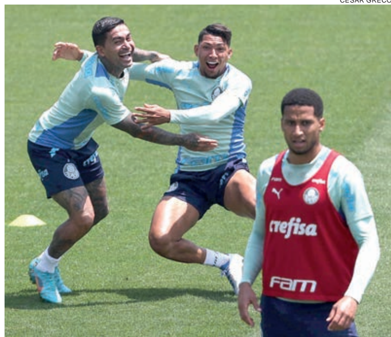
Descontração marcou último treino do Palmeiras