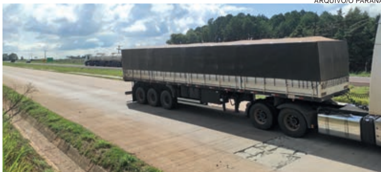
De janeiro de 2022 até agora já foram 86 flagrantes por excesso de peso, com um total de 464 toneladas de excesso constatados

Ricardo Barreto Salgueiro, chefe do Núcleo de Policiamento e Fiscalização da PRF de Cascavel, disse que o começo do ano até agora os policiais já