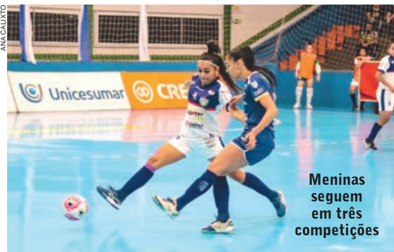
Meninas seguem em três competições

Cascavel - A temporada de jogos decisivos continua para o Stein Futsal. Enquanto aguarda o adversário para as semifinais do Campeonato Paranaense, a equipe garantiu vaga entre as quatro melhores equipes da Liga Feminina de Futsal com uma vitória sobre o Cianorte, por 2 a 0. A equipe cascavelense espera o duelo entre Female e Londrina para saber o adversário. Os dois times se enfrentam nesta terça-feira (11), em Chapecó, com