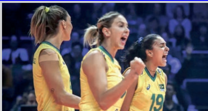
A seleção Brasileira feminina de vôlei encara o Japão pelas quartas-de-final do Mundial que acontece na Holanda. O jogo está marcado para 15 horas e vale vaga nas semifinais. Na primeira fase, o Japão foi o único a derrotar o Brasil. Quem vencer pega o vencedor de Itália x China.