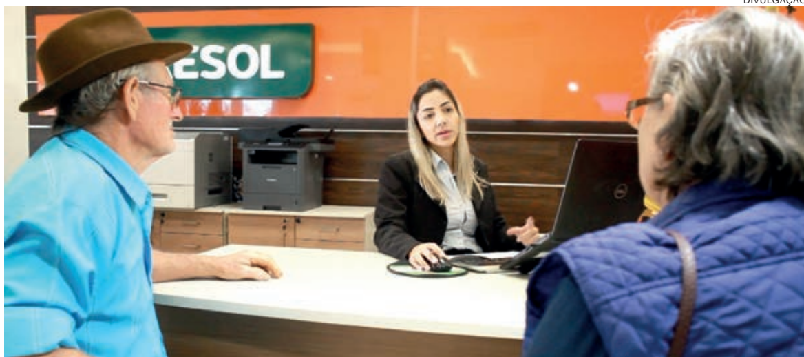
Ranking divulgado pelo BNDES compreende os primeiros nove meses do ano

A conquista, de acordo com o vice-presidente da Cresol