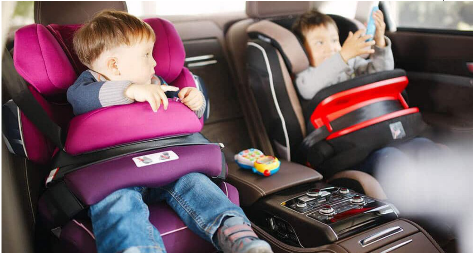
Instalação correta do bebê conforto, cadeirinha e do assento de elevação são determinantes para evitar riscos

“Para a segurança das crianças, os equipamentos devem ser utilizados adequadamente. Mais do que cumprir a lei, pais, mães e responsáveis devem seguir as exigências para assegurar que as crianças estejam protegidas em caso de acidentes. Lembrando sempre que, após ultrapassar 1,45 metro de altura ou os 10 anos de