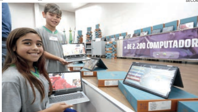
Depois dos alunos, agora é a vez da compra de notebook para os professores da rede municipal

Segundo o edital do pregão eletrônico, os equipamentos devem ser entregues em até 90 dias do processo licitatório concluído, ou seja, já início de 2023.