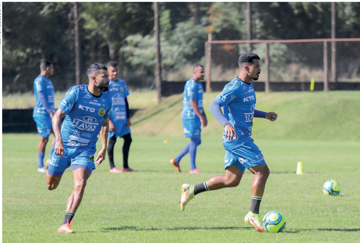
FC Cascavel retorna aos treinos no mês de novembro com novo comando