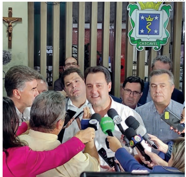
Ratinho Junior em sua primeira visita à Cascavel na condição de governador do Paraná reeleito: investimentos na cidade e no campo

A Secretaria Municipal de Agricultura lançou durante o evento o Programa do Anel Viário Rural, que tem como objetivo pavimentar 155 quilômetros de asfalto para ligar os sete distritos municipais da