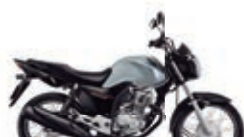
3º Prêmio: Motocicleta CG 160cc START - Ano/Modelo 2022