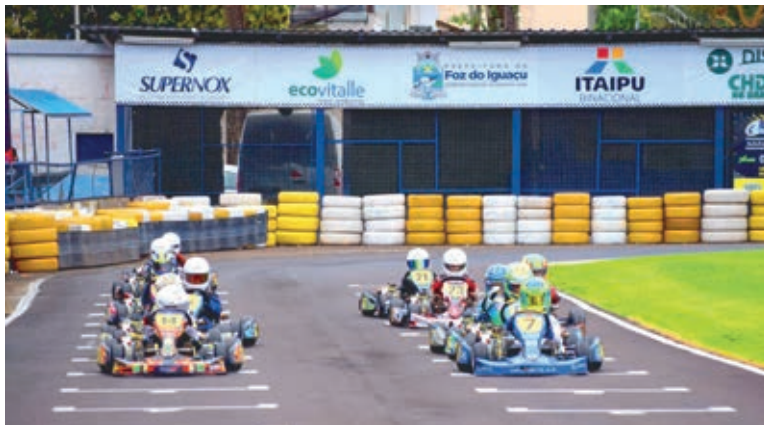
O Citadino de Kart de Foz do Iguaçu tem a expectativa de bons grids na última etapa