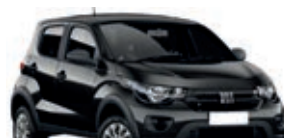
2º Prêmio: Fiat Mobi EASY 1.0 FLEX MANUAL, Ano 2021, Modelo 2022