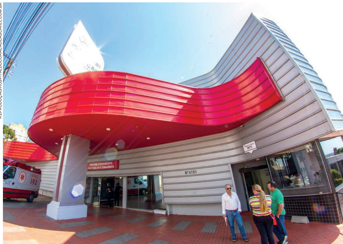
A partir de hoje, hospital encerra atendimento SUS e particular

O novo fluxo definido pela Regional segue o seguinte formato: pacientes de urgência e emergência que antes iam para