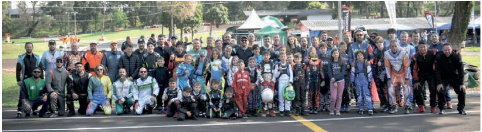
Kartistas participantes da 2ª etapa, disputada em Pato Branco

Tradicional competição do kartismo nacional, com mais de 50 anos de existência, o Campeonato Paranaense deste ano terá os campeões de todas as categorias conhecidos na última etapa. Para a definição dos campeões, os competidores descartarão duas das seis baterias disputadas em três etapas.