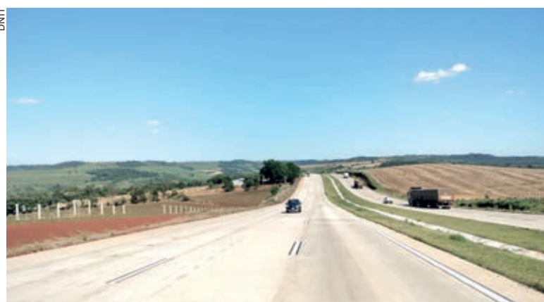
Veículos já transitam na pista nova da BR-163

próxima segunda-feira será liberado outro segmento, do km 140,9 ao km 147,5. Além disso, outros seis trechos da obra devem ser finalizados até o final do ano.