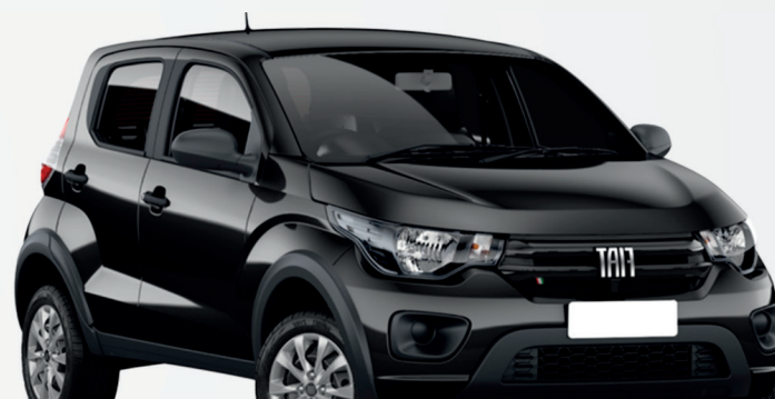
2° Prêmio: Fiat Mobi EASY 1.0 FLEX MANUAL, Ano 2021, Modelo 2022