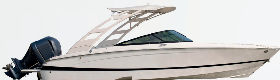
1° Prêmio: Lancha motorboat Evinrude 225

Sorteio 30/11/2022 pela extração da Loteria Federal