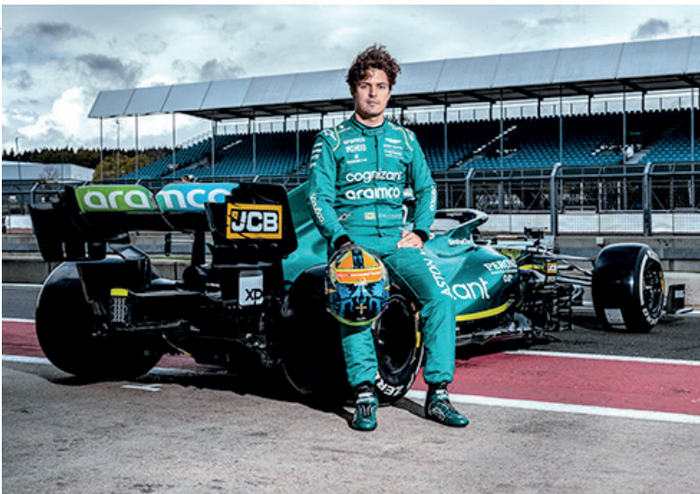
Felipe Drugovich é piloto de desenvolvimento da Aston Martin e acompanha a equipe no GP Brasil de Fórmula 1

Felipe Drugovich está em São Paulo e acompanhará a Aston Martin em todas as atividades da equipe ao longo do Grande Prêmio Brasil de Fórmula 1 neste fim de semana.