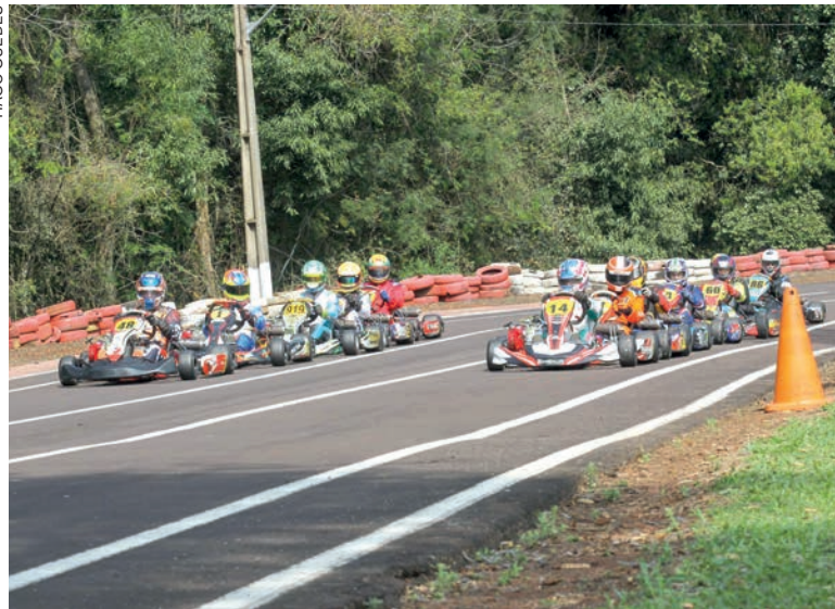
Com bons grids, o Paranaense de Kart chega a Rio Negro com os títulos em abertos em todas as categorias

9 às 9h15, treino da categoria Super F-4. Os treinos classificatórios para a definição do grid de largada serão das 9h50 às 9h57, Cadete/Mirim; das 10 às 10h07, F-4 Júnior; das 10h10 às 10h17, Super F-4 Mais; e das 10h20 às 10h27, categoria Super F-4. A primeira prova classificatória será das categorias Mirim/Cadete, com largada às 10h30. Na sequência acontecerão as provas da F-4 Júnior, Super F-4 Mais e Super F-4. À tarde, das 13 às 13h15, treino das categorias Júnior Menor/Júnior/Novatos; das 13h20 às 13h35, Graduados; das 13h40 às 13h55, Sênior A/Sênior B/Super Sênior; e das 14 às 14h15, F-4 Graduados/F-4 Sênior/F-4 Super Sênior/F-4 200; das 14h50 às 14h57, treino classificatório das categorias Júnior Menor/Júnior/Novatos; das 15 às 15h07, Graduados; das 15h10 às 15h17, Sênior A/Sênior B/Super Sênior; e das 15h20 às 15h27, treino classificatório das