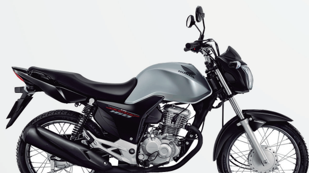
3° Prêmio: Motocicleta CG 160cc START - Ano/Modelo 2022