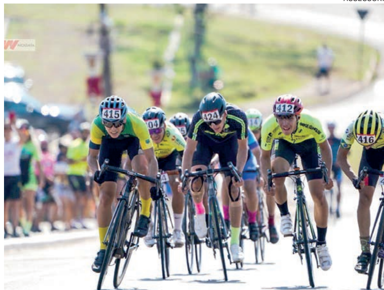
Provas especiais reúnem principais atletas do país

No domingo, será realizada a prova de Circuito, a partir das 7 horas. Um traçado especial está montado na região do Ecopark e promete exigir muito fôlego dos atletas. Na parte da tarde acontece a prova final em um dos percursos preferidos para treinos dos ciclistas de Cascavel. Eles irão percorrer cerca de 18km, saindo e chegando em Espigão Azul.