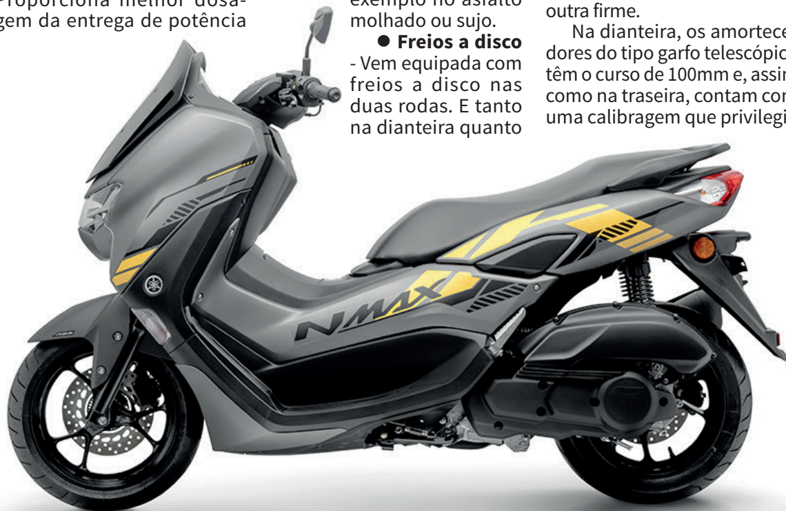
A Yamaha inova mais uma vez com a NMAX Connected 160 ABS, consolidando-se como a mais moderna e completa scooter da categoria

Além de eficientes, os pneus que equipam a NMAX Connected 160 ABS também são largos. Suas medidas são de 110/70 na dianteira e 130/70 na traseira.