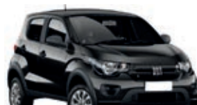
2º Prêmio: Fiat Mobi EASY 1.0 FLEX MANUAL, Ano 2021, Modelo 2022