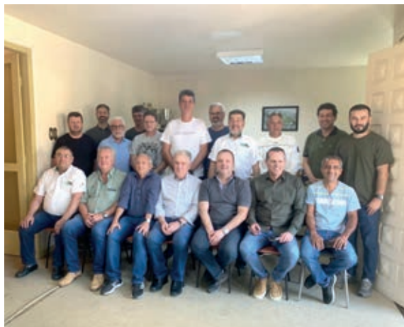
Participantes da assembleia posam para a foto histórica