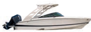
1º Prêmio: Lancha motorboat Evinrude 225

Sorteio 30/11/2022 pela extração da Loteria Federal