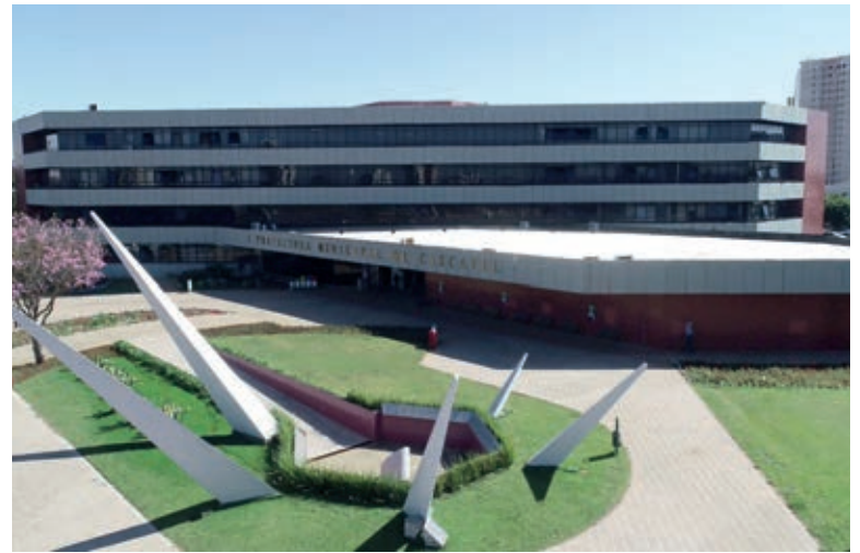
Prefeitura fecha mais cedo nos dias de jogos, mantendo serviços essenciais sem alteração de horário

publicou portaria que modifica os horários de atendimento dos serviços públicos. Nesta quinta-feira (24), os atendimentos das repartições da Prefeitura e unidades de saúde, serão das 8h às 14h. Já as escolas e Cmeis (Centros Municipais de Educação Infantil) terão aula normal no período matutino e com dispensa aos alunos da tarde, a partir das 15h30.