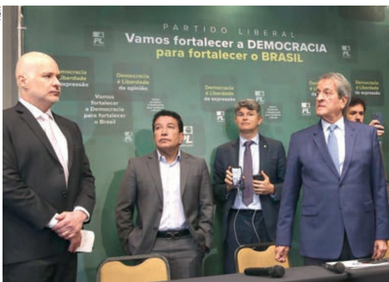
Laudo de auditoria contratada pelo PL indica inconsistência em mais de 279 mil urnas

O relatório aponta que, a partir da auditoria realizada apenas com base nos resultados decorrentes das urnas do modelo UE2020 (40,82% do total das urnas utilizadas no segundo turno) – deveriam ser computados 26.189.721 votos para Jair Messias Bolsonaro e 25.111.550 votos ao candidato Luiz Inácio Lula da Silva, resultando em 51,05% dos votos válidos para Bolsonaro, e 48,95% para Lula.