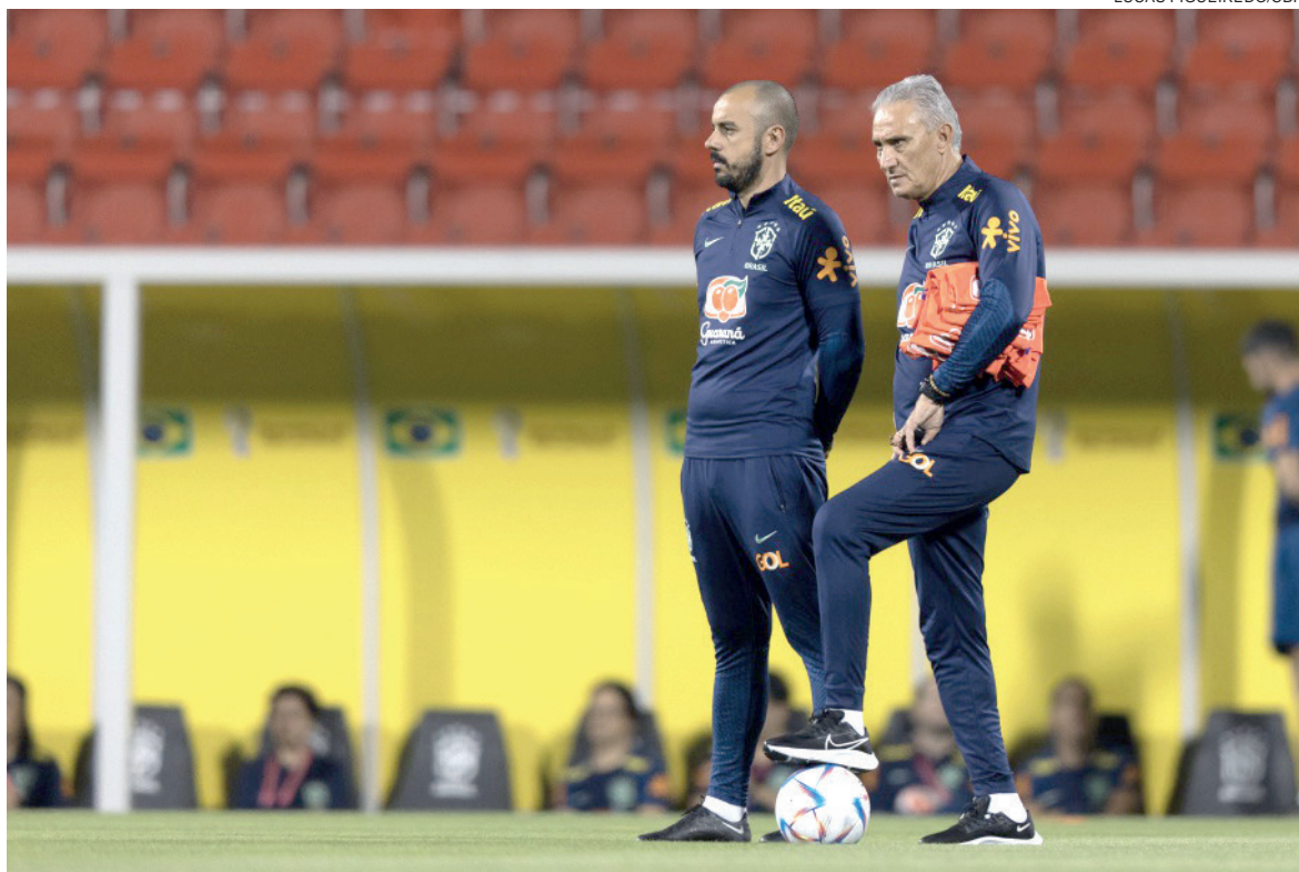
Pontas e time ofensivo. Tite tenta resgatar DNA do futebol brasileiro

Aos 38 anos de idade, o defensor já defendeu a seleção brasileira em 109 jogos, em muitas delas como capitão da equipe, e tem sete gols marcados.