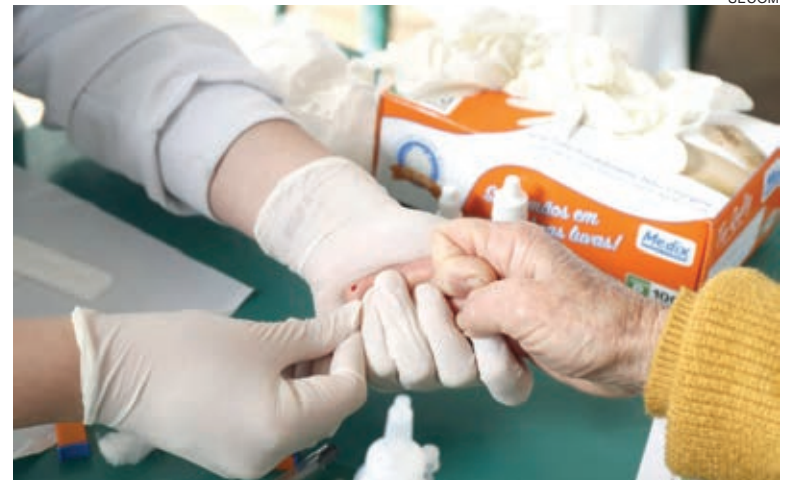
Em Cascavel, Cedip disponibiliza o teste rápido de forma permanente

O Cedip conta com disponibilização de teste rápido gratuito de HIV/Aids para população de segunda a quarta, das 7h às 12h, e na quinta das 7h às