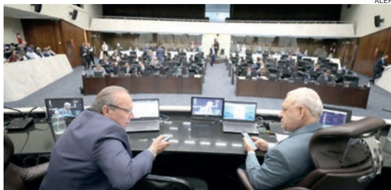
Aprovação final do maior ICMS do Brasil foi com votação simbólica

A proposta também prevê a elevação da alíquota do imposto sobre refrigerantes, águas gaseificadas com sabor, refrescos, isotônicos e cervejas sem álcool de 18% para 20%. Com a aprovação da redação final, o PL será encaminhado para o governador Ratinho Junior (PSD) sancionar. Após ser sancionada a nova lei, o Paraná será o estado com o