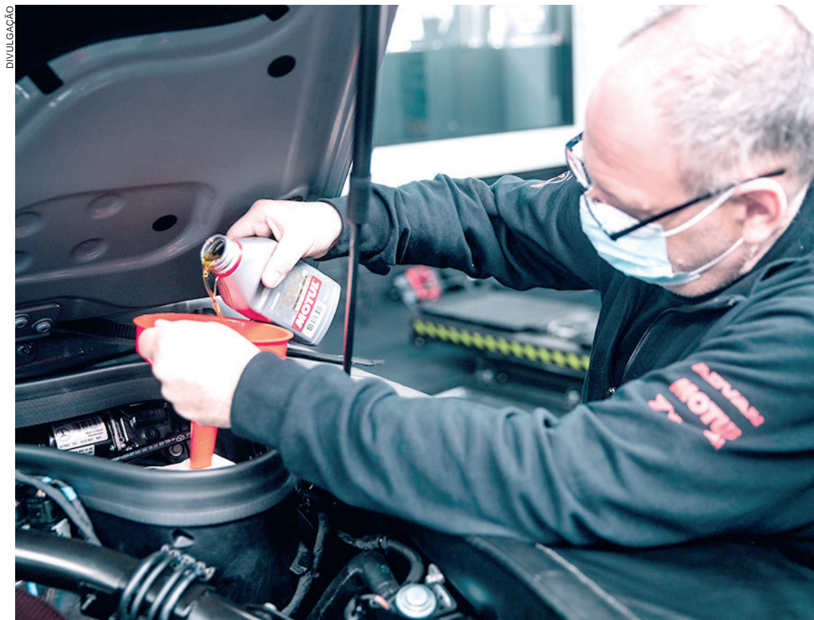
Entre os principais pontos de atenção após dias com o carro parado, estão a condição da bateria, calibragem dos pneus, nível do óleo e combustível, e a limpeza interna e externa do automóvel

Mesmo com o carro em desuso, a bateria continua funcionando para sistemas periféricos, porém itens como alarme, LEDs de alerta e sistemas eletrônicos influenciam no consumo do componente. O descarregamento se intensifica em carros modernos visto que possuem um número maior de sistemas eletrônicos. “A bateria de um veículo parado pode