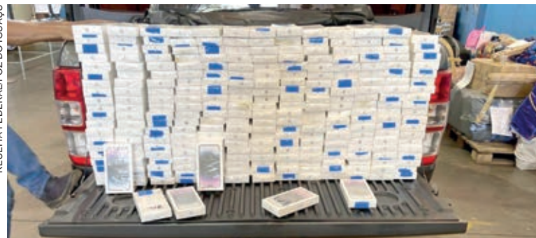
RECEITA FEDERAL/FOZ DO IGUAÇU

É necessário abrir um parêntese para uma particularidade sobre os principais produtos apreendidos na alfândega pela Receita Federal em Foz do Iguaçu. Nos últimos anos, essas apreensões tinham o topo do ranking ocupado pelos cigarros. Entretanto, neste ano, o item com maior volume de apreensões são os aparelhos celulares,