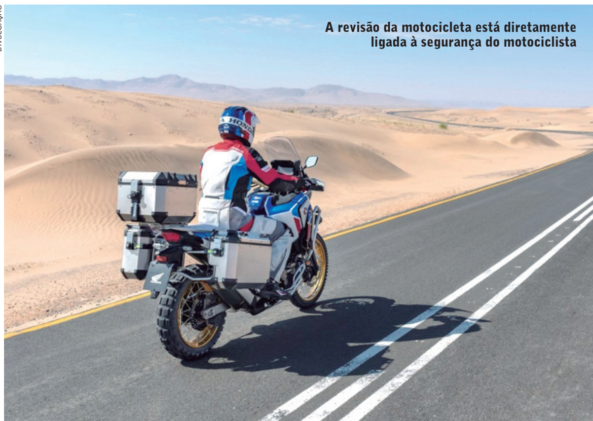
A revisão da motocicleta está diretamente ligada à segurança do motociclista

Observe se a corrente está lubrificada, o que é uma condição para ter um correto funcionamento na estrada. “Se a transmissão estiver seca, além de gerar desgaste, corre o risco de travar ou romper, o que pode provocar um acidente”, alerta Rocha. Além de estar lubrificada, a corrente precisa ter a folga ajustada da forma correta – confira aqui como fazer esse ajuste.