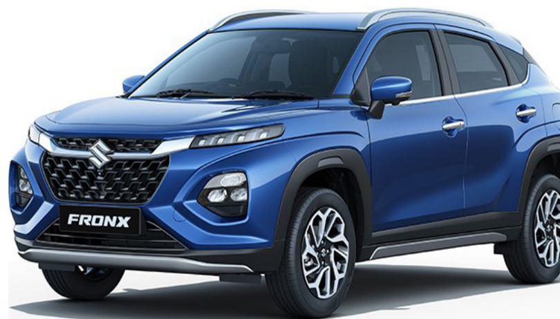
O novo Fronx é um SUV estilo coupé que oferece a seus ocupantes uma carroceria compacta no conceito "easy to drive"

Índia será o primeiro mercado a comercializá-lo.