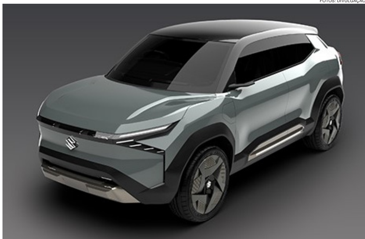
O eVX é um modelo que combina o forte DNA 4x4 da Suzuki com desing e tecnologias extremamente avançados

Seu exterior foi projetado para ser instantaneamente reconhecível como um SUV da Suzuki. Além disso, o eVX pretende levar adiante o legado