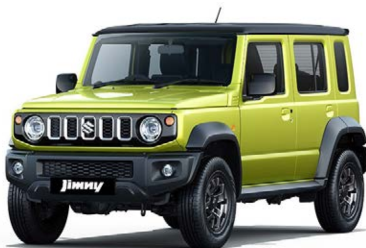
Robustez para o off-road, aliado ao conforto e ao excelente conjunto mecânico, fizeram do Jimny Sierra um sucesso global

Sua produção começará em maio deste ano e, a princípio, a