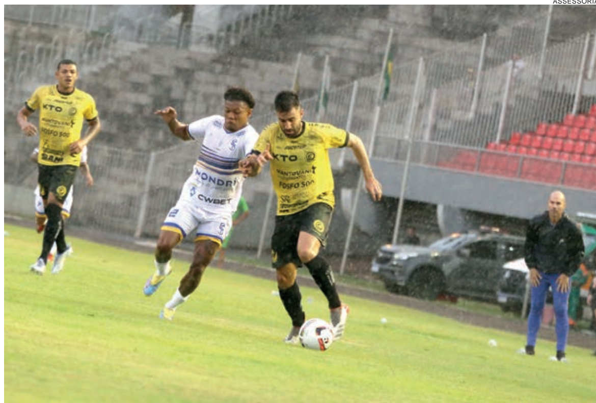
FC Cascavel busca nova vitória para se manter entre os líderes do Campeonato Paranaense

As duas equipes já se enfrentaram em 13 oportunidades com cinco vitórias do FC Cascavel, quatro vitórias do Londrina e quatro empates. Nos gols marcados o time do oeste também leva vantagem, 16 a 15, porém, o Londrina levou a melhor na decisão do campeonato de 2021, ficando com o título.