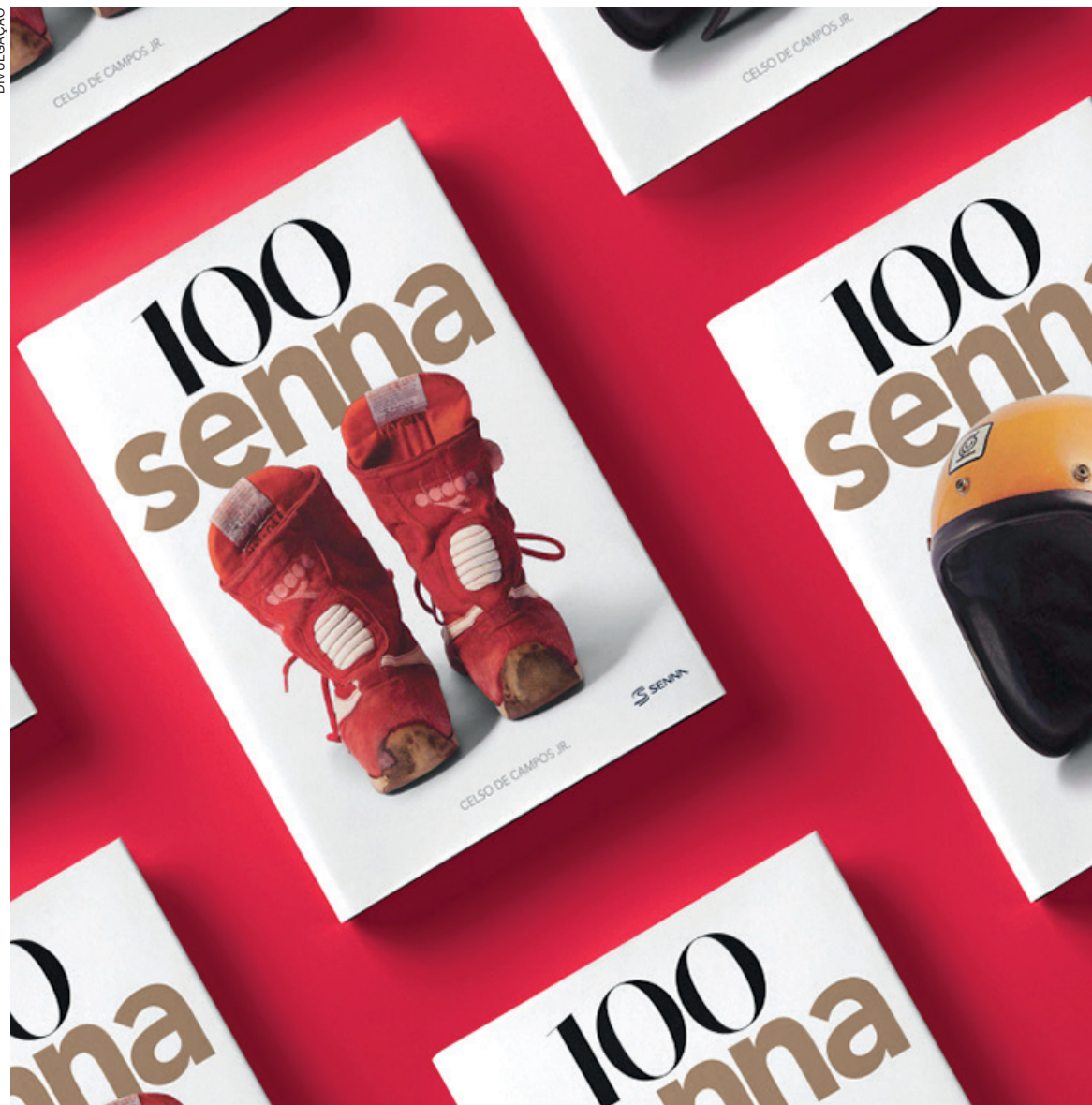
Obra do jornalista Celso de Campos Júnior mostra detalhes da vida do tricampeão mundial de Fórmula 1

Neste relançamento as unidades produzidas serão comercializadas na loja oficial Senna Shop ( https://www.sennashop.com.br ), nas principais livrarias do País, e também nos sites da editora Arte Ensaio. Para deixar a experiência ainda mais