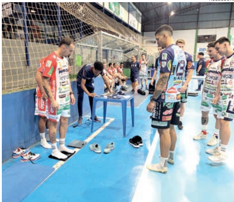
Trabalho começou com avaliações físicas