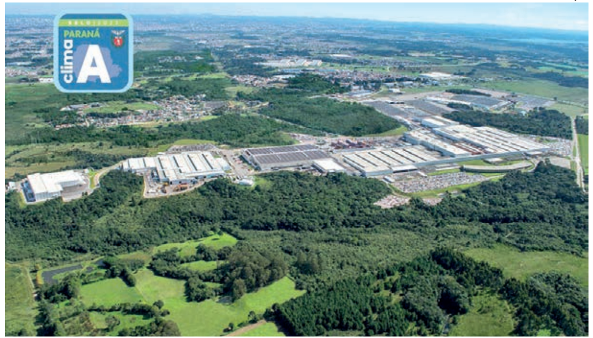
A Renault preza pelo respeito rigoroso da legislação ambiental vigente, assegurado há quase duas décadas no Complexo Industrial Ayrton Senna, em São José dos Pinhais, no Paraná

Há 11 anos consecutivos, a Renault do Brasil divulga com transparência suas ações ESG. No último Relatório de Sustentabilidade, o destaque no