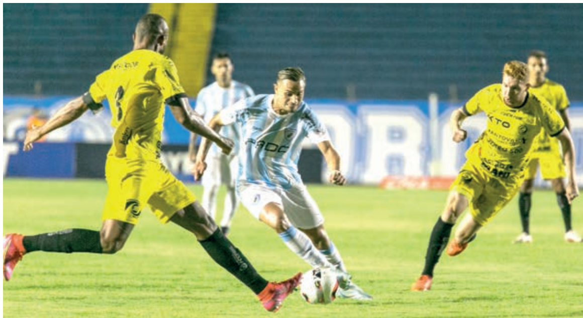
Serpente superou pressão e colheu mais uma vitória, jogando fora de casa, contra o Londrina

“Foi um jogo muito difícil. Eles nos pressionaram bem, com um jogo bem encaixado. Acho que valeu todo o trabalho e o gol que garantiu mais um resultado positivo. Fiquei muito feliz. Sou muito grato à Deus e ao Giba (Preparador de Goleiros) por