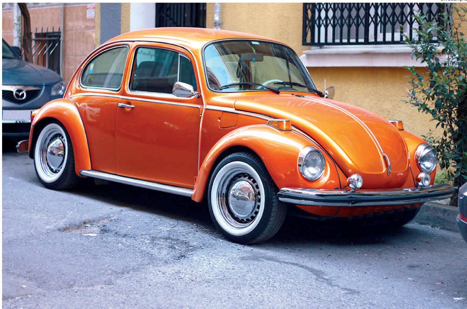
O Dia Nacional do Fusca, é comemorado no dia 20 de janeiro, data que marca o início da produção do modelo no Brasil, em 1959

De acordo com Recio, como o manual do proprietário indica o uso de lubrificantes obsoletos, se torna complexo seguir a recomendação idêntica à apresentada no tutorial. Por exemplo, em um Fusca do final da década de 70, a recomendação é utilizar um óleo com nível API SE, cuja comercialização não é mais permitida para lubrificantes convencionais, segundo