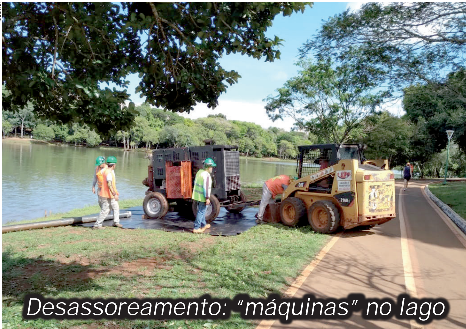
Desassoreamento: "máquinas" no lago

Depois de um longo período de espera, o desassoreamento do Lago Municipal de Cascavel está perto de virar realidade. Quem passa pelo local, já consegue observar a movimentação envolvendo máquinas e equipamentos que serão utilizados para a retirada dos sedimentos. A previsão é iniciar a dragagem nos primeiros dias de fevereiro.