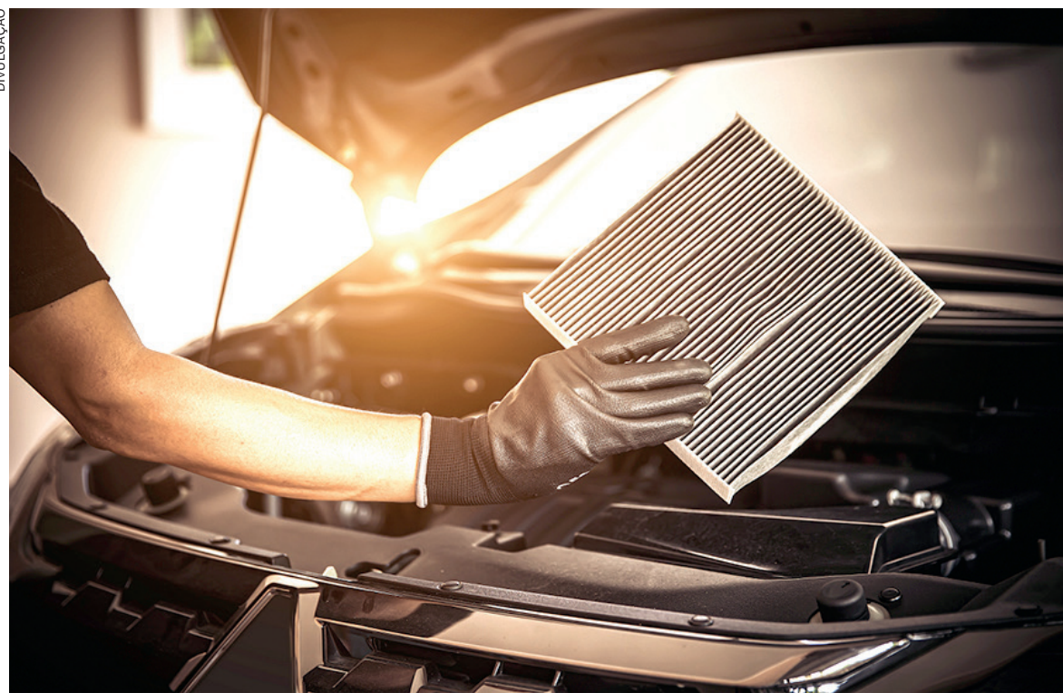
Com as altas temperaturas não podemos nos esquecer da correta manutenção do ar-condicionado do veículo

indicada a cada seis meses, é a realização de um “check-up” preventivo em todo o ar-condicionado do carro, que opera a partir de um sistema de expansão e compressão de um gás, conhecido como fluido refrigerante. Esse sistema é responsável por comprimir esse gás, aumentando sua pressão e sua temperatura. Além disso, existe um sistema de mangueiras, condutores e ventoinhas, que complementam o trabalho de refrigeração