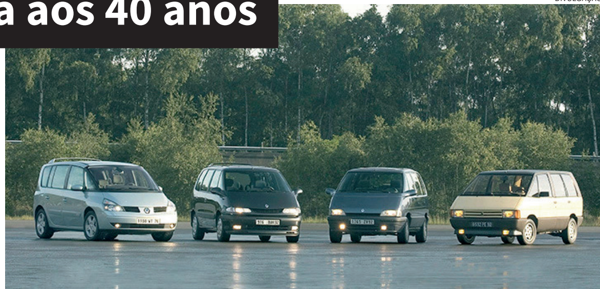
O Renault Espace sempre foi imitado, mas nunca igualado ao longo de 40 anos

Em 1983, a Renault revelou o que pode ser considerado como o primeiro ‘carro para viver’. Ele chegava com um nome emblemático, que entrou para a história dos nomes dos modelos da Renault: Espace. Quarenta anos depois, a sexta geração que será lançada deste modelo, continua remetendo ao mesmo conceito baseado nos pilares de conforto, espaço generoso e equipamentos topo de linha. Viajar dentro do Espace sempre foi uma experiência única e incomparável. Isso porque, a cada geração, o veículo soube se adaptar ao seu tempo sem negar seu DNA de grande SUV