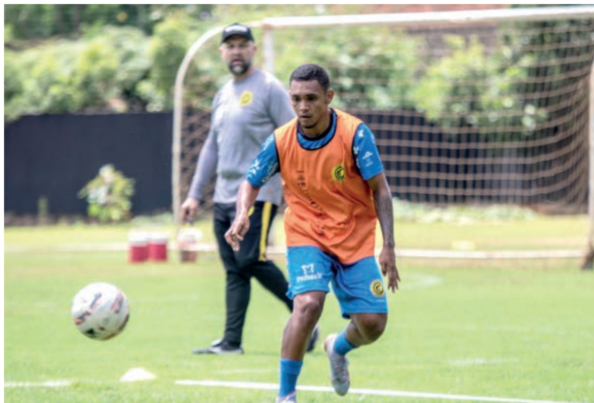
Treinos indicam manutenção do time para jogo desta noite

Rio Branco e Aruko fazem o principal jogo da parte de baixo da tabela. Quem vencer segue vive na competição. Entre os líderes, o Athletico é o favorito diante o Foz, enquanto o Coritiba vai até Maringá para tentar evitar o avanço do time da casa que contará com estádio lotado.