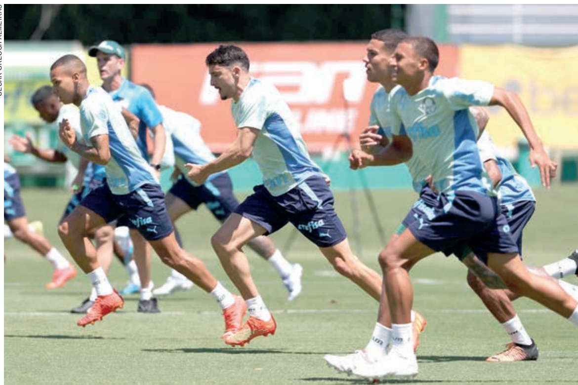
Palmeiras finaliza preparação nesta sexta-feira

São cinco vitórias do Flamengo em 12 partidas disputadas. O duelo terminou empatado em seis oportunidades. O Palmeiras venceu apenas uma vez, na prorrogação, mas de forma marcante: levou o título sobre o rival na Copa Libertadores 2021.