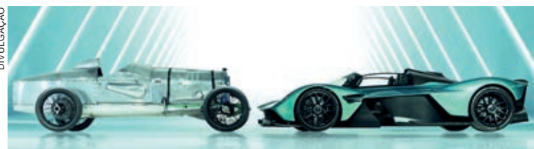
Valkyrie e Razor Blade representam os 110 anos de história da Aston Martin

Um dos primeiros carros desenhados com preocupação aerodinâmica, e empurrado por um motor Aston Martin com especificação de grandes