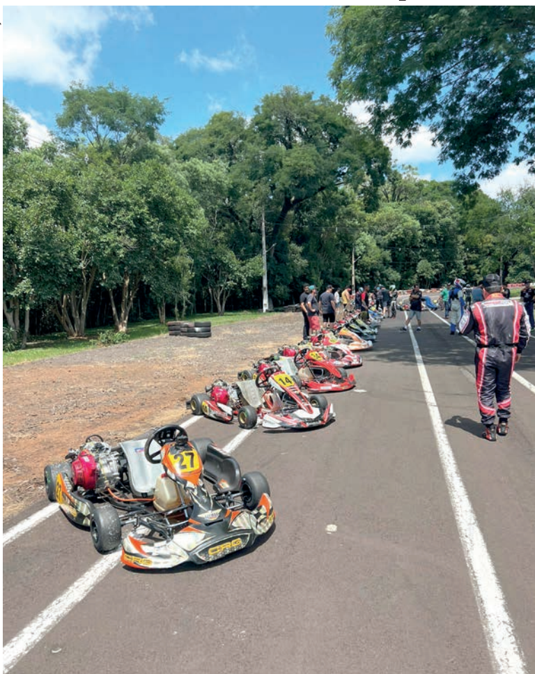
A largada da prova StocKart foi ao estilo Le Mans

Nos próximos dias o Kart Clube de Pato Branco divulgará o calendário do Campeonato Pato-Branquense.