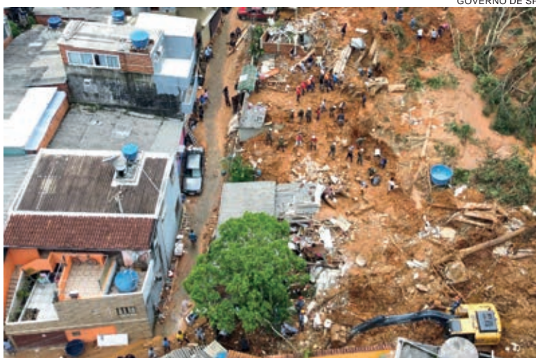
GOVERNO DE SP

O capitão Gomes explica que o auxílio aos municípios na elaboração das declarações de normalidade, situação de emergência ou de estado de calamidade pública é uma das fases de trabalho da Defesa Civil em casos de desastre, feito de forma concomitante às ações de resposta. Esse passo é necessário para que as prefeituras possam agilizar recursos estaduais ou federais para atender as necessidades da população e a possível reconstrução dos locais afetados.