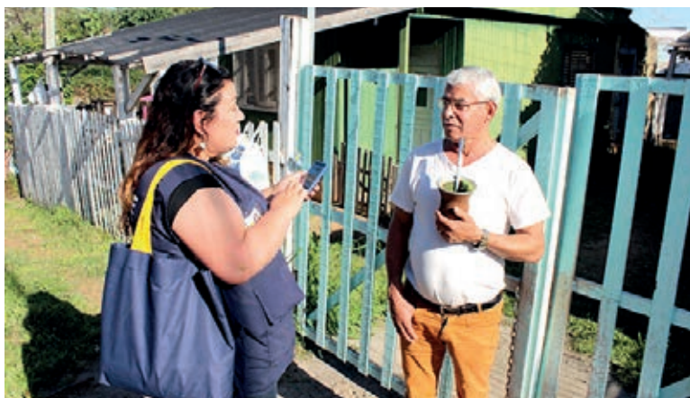
Censo 2022 ainda não foi concluído e dados preliminares não serão utilizados para o FPM

Em seu voto pelo referendo, o ministro Lewandowski explicou que o último censo de fato concluído pelo IBGE foi o de 2010, e, para salvaguardar a situação de municípios que apresentem redução de seus coeficientes decorrente de mera estimativa anual do IBGE, a Lei Complementar 165/2019