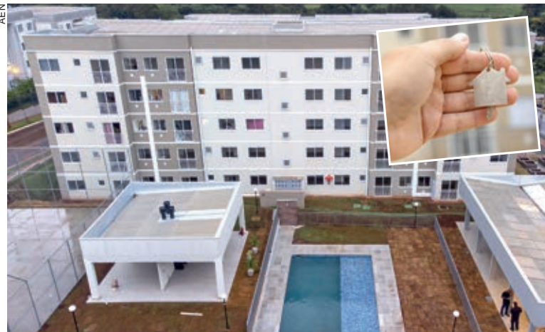
O Forest Fit segue o modelo de condomínio clube, com playground, salão de festa, churrasqueiras e piscina

Apenas em Cascavel, já foram liberados R$ 19,3 milhões em subsídios estaduais, o suficiente para bancar a entrada de 1.289 moradias. Na região Oeste, são 2.600 imóveis disponíveis nesta modalidade, totalizando quase R$ 39 milhões de investimento. No site da Cohapar, é possível consultar a lista de outros empreendimentos disponíveis em cada município com detalhes sobre os conjuntos e os imóveis.