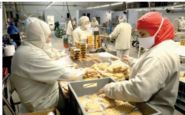
Depois de Curitiba, Agência do Trabalhador de Toledo foi destaque no encaminhamento de empregos formais no primeiro mês de 2023

O chefe da pasta ressaltou ainda que o volume de colocações via rede estadual deve apresentar percentuais de