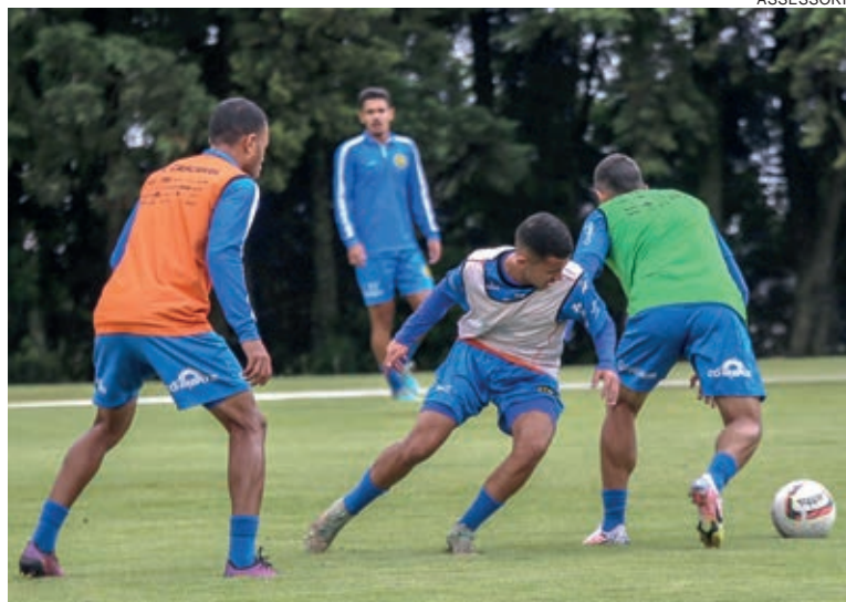
Time está pronto para enfrentar o rebaixado Foz

Pelo menos cinco times estão na briga por três vagas na próxima fase. No entanto, as classificações e posições estão atreladas à combinação de resultados. São Joseense, FC Cascavel e Londrina dependem de seus resultados. Aruko e Azuriz correm por fora e dependem de derrotas dos times que estão mais à frente.