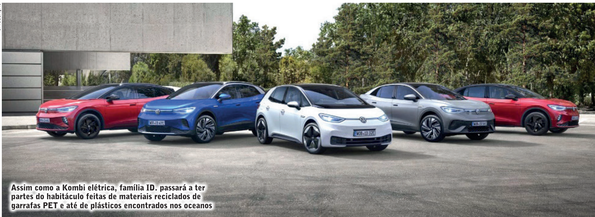
Assim como a Kombi elétrica, família ID. passará a ter partes do habitáculo feitas de materiais reciclados de garrafas PET e até de plásticos encontrados nos oceanos

Evite passar por poças de água grandes ou profundas, pois elas podem causar aquaplanagem e reduzir ainda mais a visibilidade.