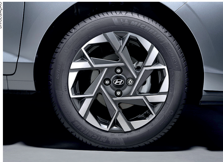
Pneus com desgaste irregular ou com pressão insuficiente podem aumentar o risco de aquaplanagem

Use seus faróis mesmo durante o dia para ajudar a melhorar a visibilidade.