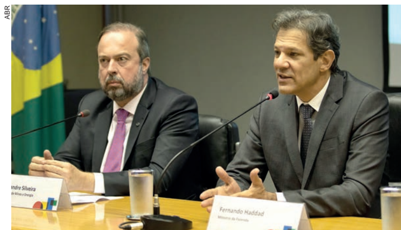
Ministros Fernando Haddad (Fazenda) e Alexandre Silveira (Minas e Energia), durante coletiva sobre a reoneração dos combustíveis

Durante coletiva de imprensa, Haddad informou que a reoneração da gasolina será de R$ 0,47 e a do etanol será de R$ 0,02. Contudo, esse não será o impacto efetivo do preço na bomba de combustível. Haddad explicou que, como a Petrobras reduziu a gasolina em R$ 0,13 por litro, o impacto