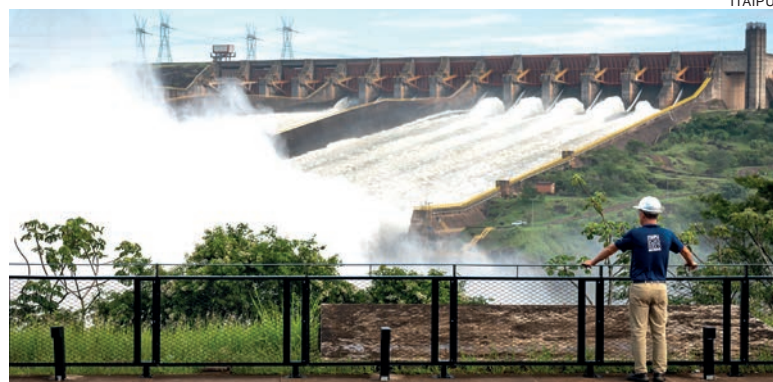
Além do fim da dívida, ontem (28), a Itaipu abriu novamente as comportas de uma segunda calha do vertedouro

A própria binacional foi a responsável pela obtenção dos empréstimos, conforme disposto no Tratado de Itaipu, assinado em abril de 1973 e que neste ano completa 50