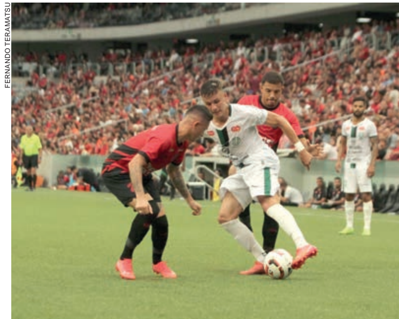
Após boa participação no Estadual, Maringá vai encarar o Flamengo na Copa do Brasil

Os times já embolsaram mais de R$2 mi por estarem nesta fase. Em caso de classificação, serão mais R$3,3 mi.