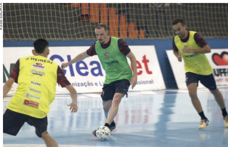
Selbach está de volta e promete título para a Serpente

O São Miguel tenta recuperação no campeonato. O time joga em casa, contra o Guarapuava, a partir das 20h. Em Laranjeiras do Sul, o Operário também quer recuperação, e