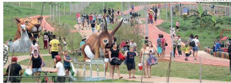
Benefícios dos ecoparks, já instalados nas regiões dos bairros Morumbi e Santa Cruz, também chegarão ao Santa Felicidade e Floresta