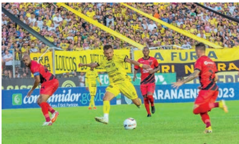
Domingo de decisão. FC Cascavel tenta entrar para a lista dos campeões

Dono da melhor campanha do Paranaense e único time da Série A invicto na temporada, o Athletico joga com a vantagem do empate para garantir