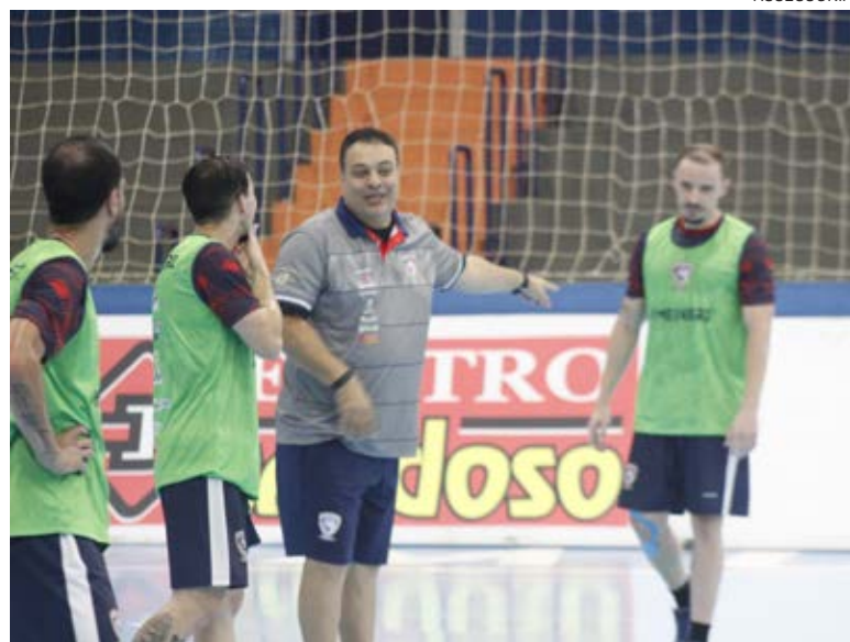
Cascavel Futsal quer acabar com série sem vitórias

O líder do grupo é o Pato Futsal, que vai jogar em casa contra o Operário Laranjeiras, atual quinto colocado. O jogo começa às 20h05.