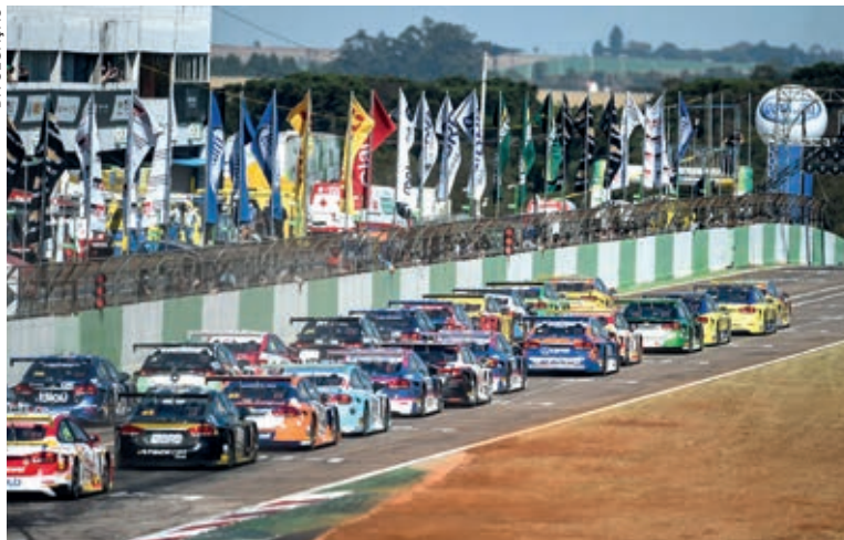
Autódromo Internacional Zilmar Beux, em Cascavel, irá sediar a 4ª etapa da Stock Car no dia 18 de junho