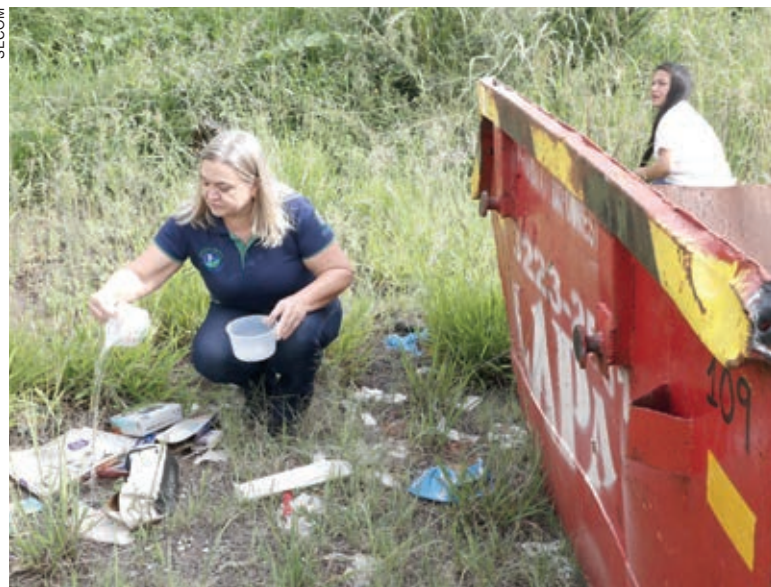
Destinação correta do lixo também é uma “arma poderosa” contra o mosquito da dengue

O novo boletim confirmou, ainda, 37 novos casos de chikungunya, somando 144 confirmações da doença no Estado. Do total de casos, 74 são autóctones quando a doença é contraída no município de residência e 44