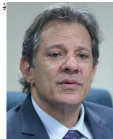
Nacional de Desenvolvimento Econômico e Social).

O teto atual de gastos prevê a exclusão das estatais não dependentes do Tesouro e dos gastos eleitorais dos limites de despesas e dos gastos da Justiça Eleitoral. O projeto de lei complementar, no entanto, manterá dentro da regra fiscal os aportes a bancos oficiais. A mudança tem como objetivo reduzir o espaço para megacapitalizações em bancos públicos, como foi feito entre 2009 e 2015 com o BNDES (Banco