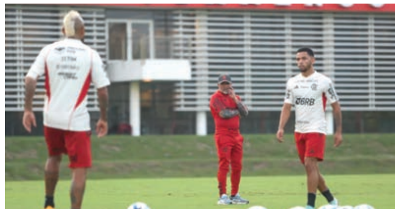
Sampaoli estreia hoje no Flamengo que busca recuperação na temporada

Mesmo fazendo tratamento, os dois foram relacionados para o jogo.