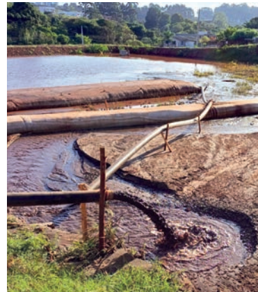
Área no Cascavel Velho já recebeu 10.650 mil metros cúbicos de sedimentos retirados do Lago Municipal