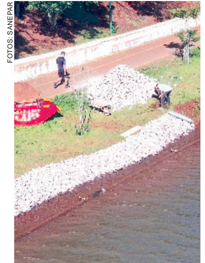
Pedras colocadas na margem ao redor do lago têm função de proteção e prevenção

“Quando planejamos a limpeza já projetamos uma forma do lago não sujar mais, por isso, essas caixas que serão planejadas tecnicamente, com profundidades diferentes ao redor do lago para receber a sujeira e terão que ser limpas de forma periódica”, explicou o secretário, que fez a comparação das caixas com a caixa de gordura residencial, que também é uma forma de evitar que toda a sujeira vá para a rede, restando a sujeira mais pesada. “Existem pontos que tem mais sedimentos e para eles é que as caixas