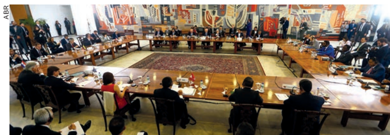
Reunião dos presidentes de países da América do Sul, no Palácio do Itamaraty

Para ele, os milhares de imigrantes venezuelanos que deixaram seu país por causa da situação política “exigem uma