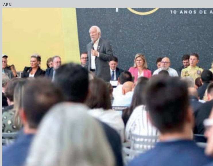
O Governo do Estado, por meio do Departamento de Trânsito do Paraná, abriu oficialmente, ontem (3), as ações do Maio Amarelo 2023, que chega à décima edição e tem como tema nacional "No trânsito, escolha a vida".

Também foram entregues veículos para o órgão de trânsito estadual, anunciados investimentos para sinalização viária em 46 municípios e apresentado o Pacto Social por um Trânsito Seguro. O vice-governador Darci Piana destacou que, apesar de maio ser um mês dedicado a causa do trânsito, os cuidados devem seguir durante todo o ano. "Não adianta realizar ações só durante este mês e depois esquecer os outros 11. Devemos estar sempre preocupados com aquilo que acontece no trânsito, cuidando desde as nossas crianças até os nossos idosos", afirma Piana.