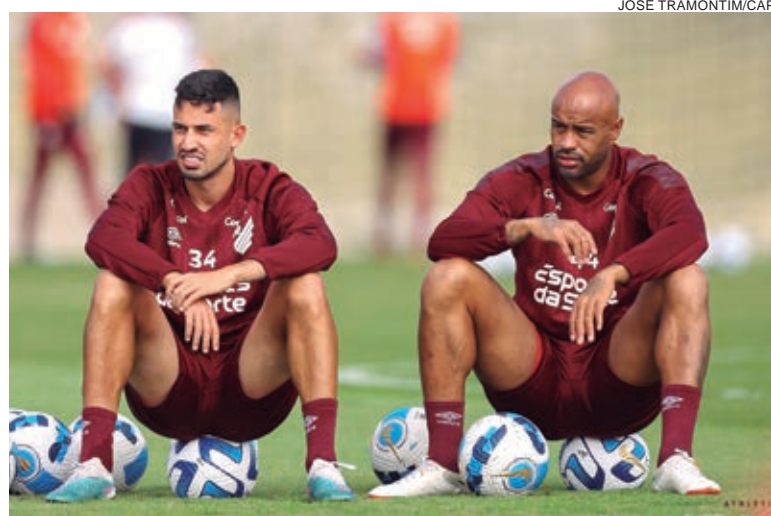
Athletico joga fora em busca da liderança

O Libertad é o líder do Campeonato Paraguaio com seis pontos de vantagem em relação ao rival Cerro Porteño no Apertura: 38 a 32 pontos. Em 15 jogos, são 12 vitórias, dois empates e apenas uma derrota. Na Libertadores, o time está um ponto atrás do Athletico.