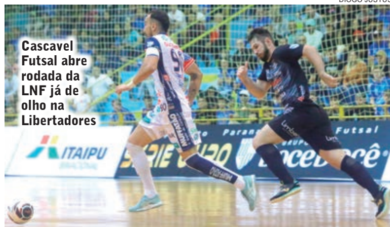
Cascavel Futsal abre rodada da LNF já de olho na Libertadores

Depois desta partida o Cascavel Futsal foca as atenções na defesa do título da Libertadores. O time estreia na competição continental no dia 21 de maio, contra o Tigres, da Venezuela. Depois, a equipe enfrenta o Panta Walon, na segunda-feira (22) e o Cerro Porteño, na terça-feira (23).