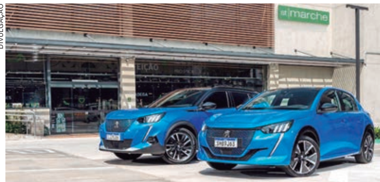
Além do Novo Peugeot e-2008, o serviço passa agora a disponibilizar também o Peugeot e-208 GT e em breve, novas estações serão inauguradas

Ambos os modelos disponíveis possuem bateria de alta performance: 50 kWh de capacidade, garantindo uma ótima autonomia e recarga rápida em até 30 minutos. Com