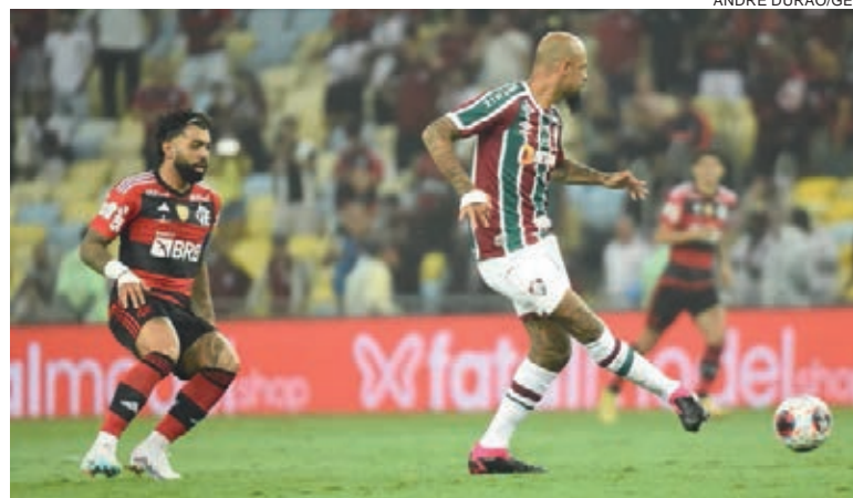
Clássico carioca pela primeira vez na Copa do Brasil