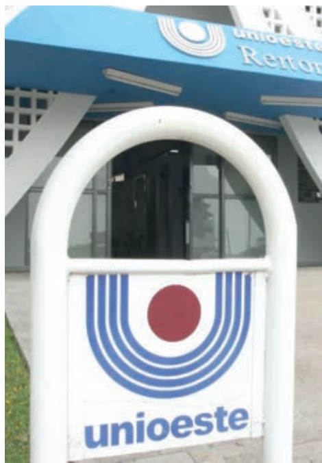
UNIOESTE/UNIVERSIDADE DO OESTE DO PARANÁ

Prejudicados diretamente pela greve dos professores, na semana passada, alunos que fazem parte do DCE (Diretório Central Estudantil), do Campus de Cascavel da Unioeste, estiveram reunidos para também deliberarem sobre a greve dos professores. Aqueles que se colocaram contra a greve, 51,2%, dos presentes, pelo “calendário acadêmico apertado”; “acordos preliminares com empresas de transporte” e porque faltam apenas “dois