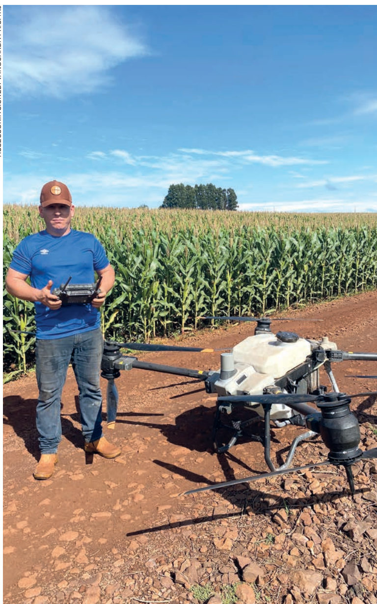
ASSESSORIA SICREDI VANGUARDA PR/SP/RJ

O associado destaca a importância da cooperativa em seus negócios. “Me auxiliam principalmente na questão de capital de giro para os meus negócios, tanto na parte de linhas de crédito para maquinários e na parte de custeio agrícola das lavouras. A proximidade e agilidade da cooperativa são fatores