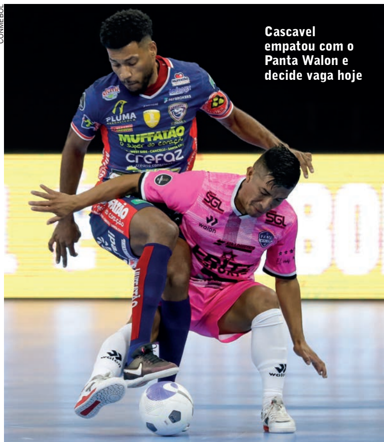
Cascavel empatou com o Panta Walon e decide vaga hoje

Cascavel – O time que mais deu trabalho para a Serpente Tricolor na Libertadores do ano passado voltou a atrapalhar os planos do time na defesa do bicampeonato. Ontem, o Cascavel Futsal empatou com os peruanos do Panta Walon, em 2 a 2, e deixou escapar a liderança do grupo A da competição que está sendo disputada na Venezuela. Na estreia, o time venceu o Tigres, por 3 a 1. Nesta terça-feira acontece a partida que define a