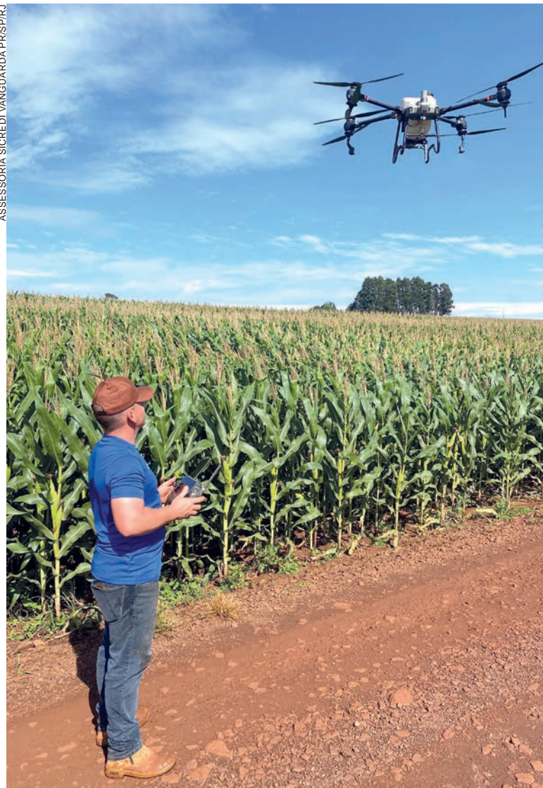
ASSESSORIA SICREDI VANGUARDA PR/SP/RJ

Com mais de 2.400 agências, o Sicredi está presente fisicamente em todos os estados brasileiros e no Distrito Federal, disponibilizando mais de 300 produtos e serviços financeiros. ( www.sicredi.com.br )