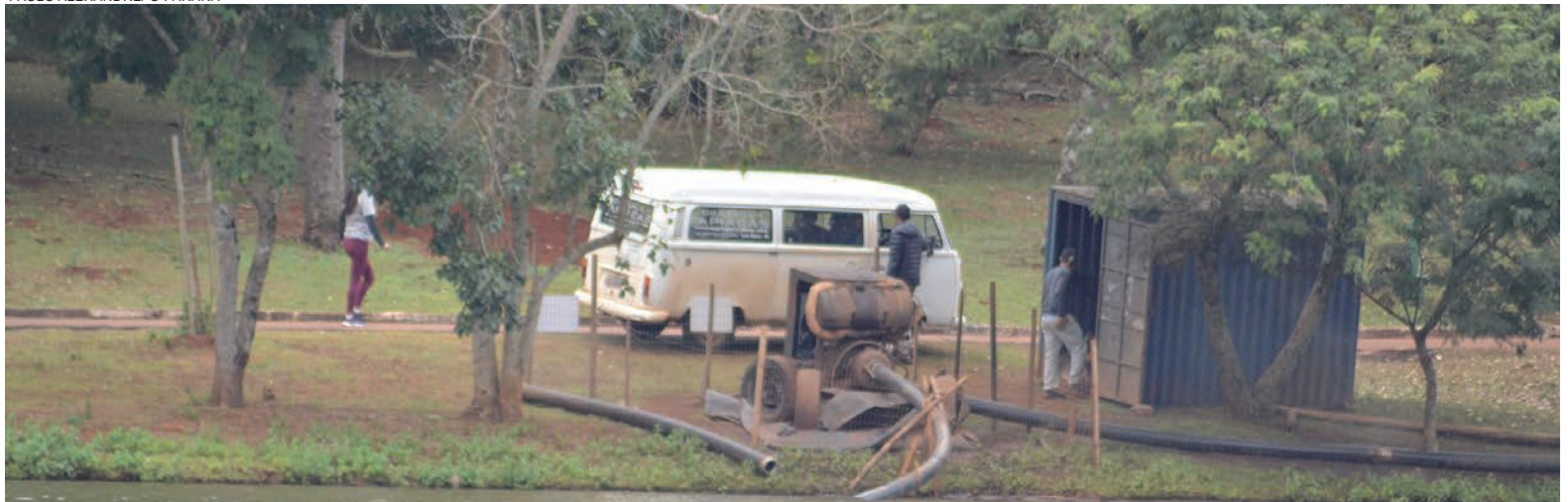
PAULO ALEXANDRE/O PARANÁ