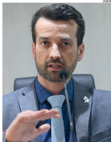
O secretário de Orçamento, Paulo Bijos, durante coletiva sobre o Relatório de Avaliação de Receitas e Despesas Primárias do 2º Bimestre de 2023

Por outro lado, houve projeção de aumento de receitas de R$ 5 bilhões com lucros e dividendos e R$ 3,1 bilhões de arrecadação com a Contribuição Social sobre o Lucro