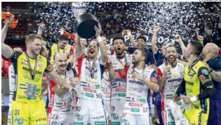
Cascavel Futsal leva o bi da Libertadores e quer mais na LNF.