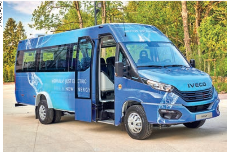
Com o eDAILY, a Iveco Bus amplia a sua oferta de micro-ônibus com uma solução de emissão zero confiável e rentável

O novo eDAILY está equipado com três baterias de 37 kWh cada, para uma