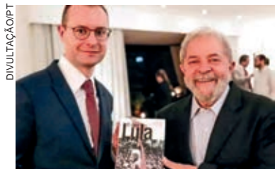
Cristiano Zanin ficou conhecido ao assumir a defesa de Lula na Lava Jato

Lula foi questionado por jornalistas se faria a indicação ainda nesta semana e o presidente disse respondeu que “Isso é uma coisa tão minha que eu não quero repartir com ninguém”. Se, de fato,