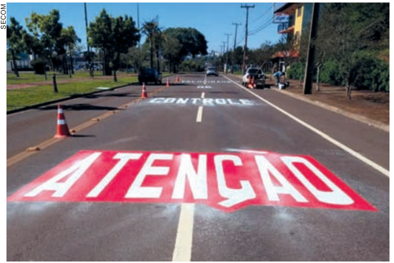
Mesmo com reforço na sinalização, índice de multas continua alto