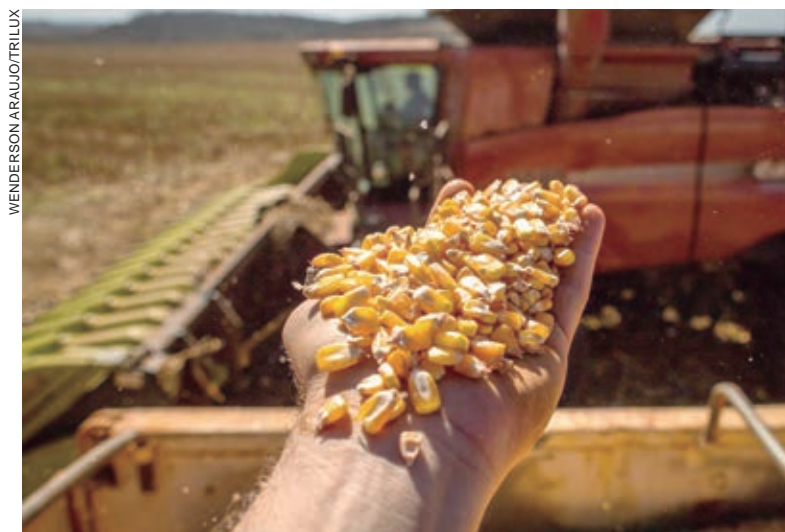
O Paraná é segundo em número de projetos e recursos do Plano Safra

Fávaro disse que uma das metas do Banco Central seria a de manter o controle da inflação. “O que tem sido alcançado com êxito”. Ele emenda: “Qual a justificativa para uma taxa de juros básica, a Selic, de 13,75%? O que ele considera sobre o emprego? E quanto ao desenvolvimento do País?”. O ministro da Agricultura e Pecuária cita que a aprovação do nome do presidente do Banco Central foi feita pelo Senado “com base em condições e compromissos e, por isso, temos o direito de cobrar a sua posição”. Logo após a declaração do ministro, a Comissão de Assuntos Econômicos do Senado fez um convite para que Roberto Campos Neto compareça a uma das reuniões da comissão para prestar esclarecimentos sobre a taxa básica de juros.