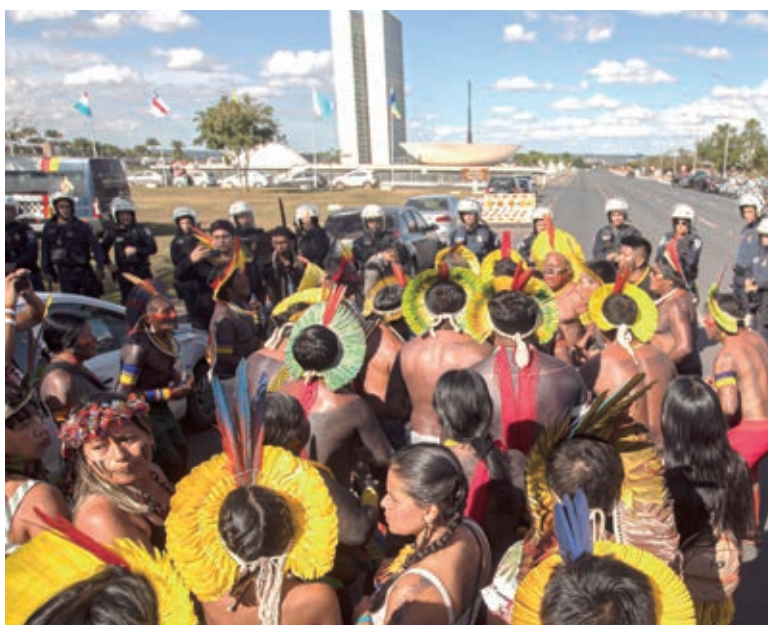
Com pedido de vistas no STF, matéria aguarda votação no Senado

Segundo a carta, o projeto de criação do marco temporal afeta negativamente a vida de milhares de indígenas do Brasil, inclusive, no Paraná. “Firmes em nosso compromisso evangélico com a vida digna para todos, dizemos não a todo projeto que possa acarretar na perda de direitos básicos fundamentais, tais como a terra. Com o nosso querido Papa Francisco, aceitamos o desafio de sonhar e pensar numa humanidade diferente [...] Um planeta que garanta terra, teto e trabalho para todos”.