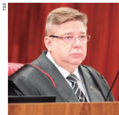
Ministro Raul Araújo abriu divergência e voto contra a inelegibilidade de Bolsonaro

Durante a sessão de ontem, o primeiro a votar foi o ministro Raul Araújo que abriu divergência do voto do relator para julgar improcedente a Aije do PDT. Araújo considerou que o discurso feito por Bolsonaro aos embaixadores não teve gravidade suficiente para quebrar