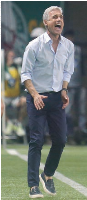
Luis Castro terá salário milionário na Arábia

Rio de Janeiro – A partida de ontem contra o Magallanes marcou a despedida do técnico Luis Castro do Botafogo. O time líder do Brasileirão deverá oficializar hoje o nome do novo comandante. O mais cotado é Rogério Ceni.