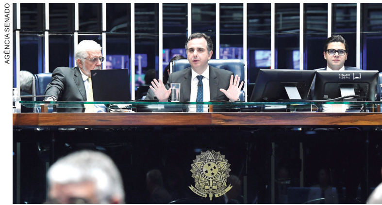
Com reforma no Senado, gestores municipais se mobilizam novamente para defender ajustes segundo a pauta municipalista

A FNP (Frente Nacional de Prefeitos) emitiu comunicado reiterando a importância e