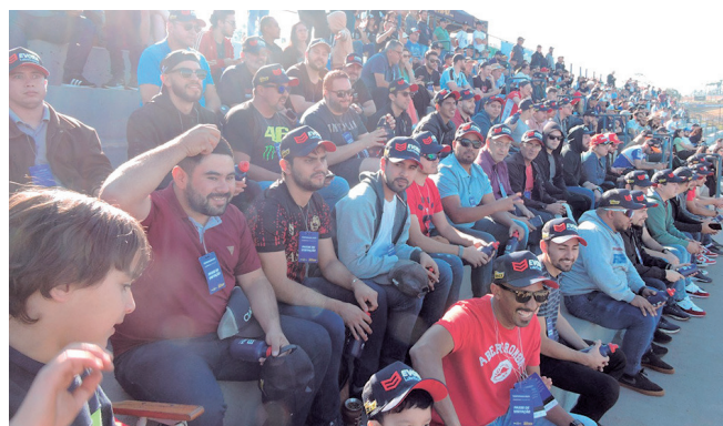
Convidados da Evora integraram a torcida da equipe Vannucci Racing e agitaram as arquibancadas do Autódromo Zilmar Beux, em Cascavel