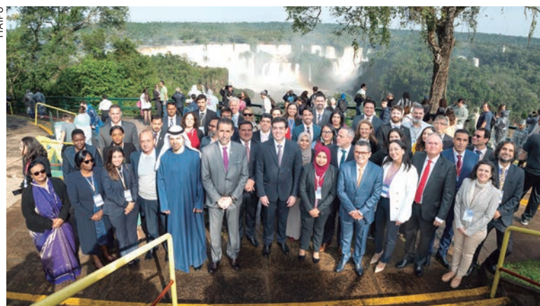
Evento global foi realizado em espaço localizado dentro do Parque Nacional do Iguaçu

Além do case de Itaipu, o grupo executivo debateu o ClimateScanner, uma ferramenta desenvolvida pelo TCU para monitorar o combate às mudanças climáticas no mundo. Também participaram representantes das ISCs (Instituições Superiores de Controle), dos ministérios de MMA (Meio Ambiente e Mudança do Clima) e