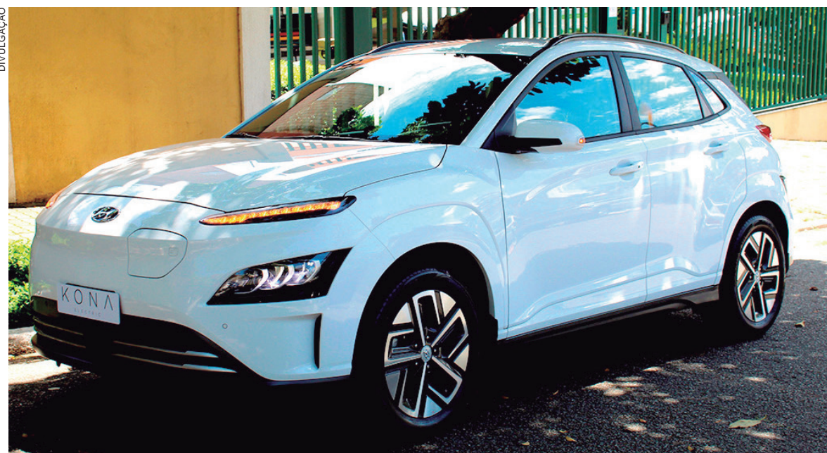
O Hyundai Kona EV é um SUV urbano premium já vendido globalmente e o primeiro produto Hyundai com propulsão 100% elétrica no Brasil

o desenho exclusivo das rodas de liga-leve de 16 polegadas. Já as lanternas traseiras, em LED, divididas em duas peças auxiliam no preenchimento visual do veículo. Tornando o visual ainda mais esportivo e instigante, o modelo tem molduras que envolvem todo o modelo, nos para-choques dianteiro e traseiro, paralamas e seguindo também em toda