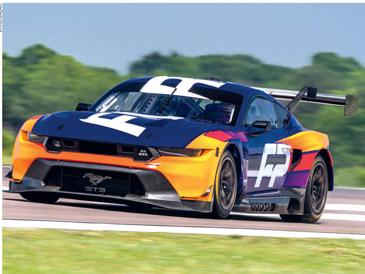
O novo carro de competição, baseado no Mustang Dark Horse 2024, será o representante da marca no famoso circuito francês

Junto com o carro, a Ford revelou também a nova logomarca da Ford Performance, com um visual mais limpo e simplificado que passará a ser visto em todos os seus carros