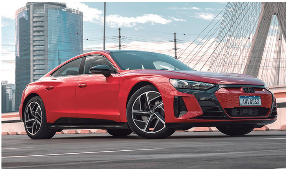
O Audi e-tron GT tem preço especial de R$ 699.000,00 até o fim deste mês

Visualmente, o e-tron GT esbanja linhas consagradas com proporções largas, silhueta plana, ampla distância entre-eixos e centro de gravidade baixo. Na dianteira, os faróis full LED Matrix separados pela grade frontal Singleframe exibem um visual harmônico e envolvente. Há ainda rodas exclusivas de 20 polegadas com detalhes em preto brilhante, frisos decorativos na cor preta e grade singleframe na cor Cinza Heckla.