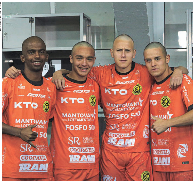
Jogadores das categorias de base ganham espaço na despedida da Série D

Cascavel – A primeira fase da Série D será encerrada neste fim de semana com a disputa de 32 jogos que irão indicar as últimas 14 vagas para os play-offs. Outros 18 times já estão garantidos, restando definir apenas a colocação em que finalizam a fase. Dos três representantes paranaenses, o Maringá é o único garantido. O São Joseense decide a passagem na rodada, dependendo apenas de seu resultado diante o Caxias para se classificar. Já o FC Cascavel faz o jogo da despedida em Catalão, Goiás, contra o CRAC, que precisa vencer para se garantir sem depender de outros resultados.